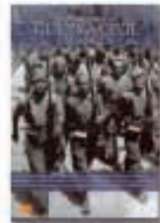
Breve Historia de la Guerra Civil Española