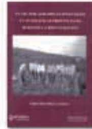
El sector agrario guipuzcoano y las políticas provinciales durante la Restauración

Este libro se detiene en los elementos más importantes para entender los procesos políticos y militares de la Guerra Civil Española, poniendo el acento en la comprensión del cómo y del por qué ocurrieron. Iñigo Bolinaga, con su habitual estilo ameno y didáctico, describe los factores tanto económicos como políticos y militares imprescindibles para el análisis y la comprensión de la contienda que marcó la historia de España. Breve Historia de la Guerra Civil Española es un libro imprescindible para todo aquel que quiera tener un conocimiento global del conflicto español.