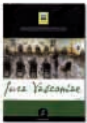
Iura Vasconiae, 5

AUTORES: GREGORIO MONREAL ZIA ET AL. DONOSTIA-SAN SEBASTIÁN: FEDHAV, 2008 421 P. : IL. ; 24 CM. ISSN: 1699-5376