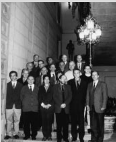
Nafarroako Gobernuaren Jauregian Batzorde Iraunkorrean bildutakoak

Abenduak 15ean Eusko Ikaskuntzak Batzorde Iraunkorreko bilera egin zuen, ohi duen bezala Nafarroako Gobernuaren Jauregian. Bildutakoek, aztertutako gaien artean, nabarmen handienekoa, XV. Kongresuari dago-kion egitaraua izan zen.