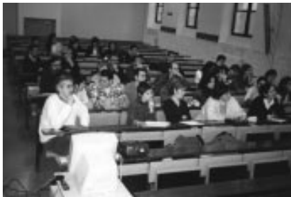
Un public nombreux participa au séminaire sur la prononciation basque

Les 13 et 14 décembre a eu lieu à Bayonne, à la Faculté Pluridisciplinaire, un séminaire sur la phonétique et la phonologie de la langue basque, organisé par Eusko Ikaskuntza, Iker-UMR 5478 (Centre de recherche de la langue basque, Unité Mixte de Recherche du CNRS, de l'Université Michel de Montaigne-Bordeaux et de l'UPPA, ) et Aholab (laboratoire de la voix de l'Ecole d'Ingénieurs en Electronique et Télécommunications de Bilbao). Ces journées,