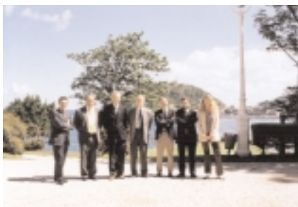
Jardunaldi hauetako irakasleak

Bajo el título Carta Europea de Derechos se celebró el pasado 18 de mayo en el Palacio Miramar de Donostia, la Jornada organizada por la Sección de Derecho de Eusko Ikaskuntza en colaboración con el IVAP. Los asistentes, examinaron el contenido y naturaleza de dicha Carta