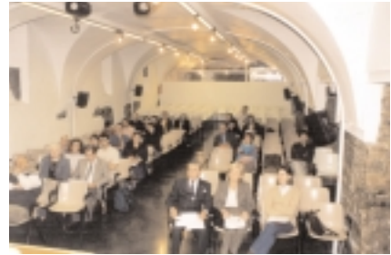
Una panorámica de la sala

Bestalde, diziplina hau aldaketa izugarriak jasaten ari da eta oso ongi islatu ziren ikuspegi metodologiko berriak topagune hauetan. Txostengile guztien ponentziak oso interesgarriak izan ziren eta jardunaldietan izan zen entzulego kopurua ere garrantzitsua izan zen.