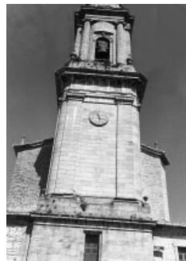
Torre neoclásica de la parroquia de San Blas, Alegria-Dulantzi

Los interesados deben enviar antes del 1 de abril el curriculum vitae y un plan de trabajo a la oficina de Eusko Ikaskuntza en Vitoria-Gasteiz.