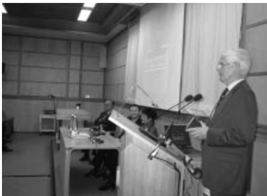
Conferencia en Oxford

Sir Marrack Goulding en el momento de la presentación del Lehendakari.