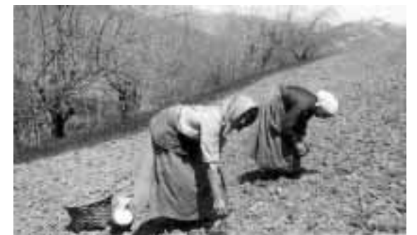
Recogedoras de patatas en Legazpi (principios siglo XX).