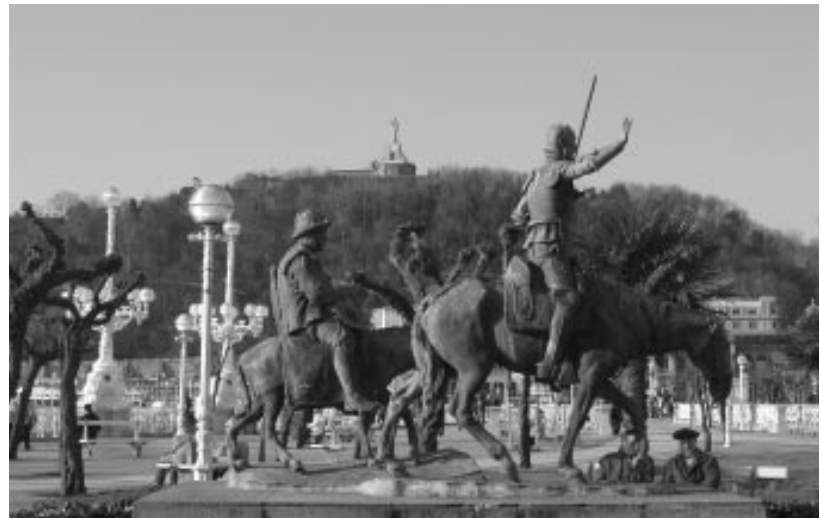
En la foto: Monumento al Quijote en Donostia.

A l'occasion du IV ème Centenaire de l'édition de l'œuvre maîtresse des lettres hispaniques, Eusko Ikaskuntza convoquera une bourse de recherche et organisera des journées d'étude, des conférences et des réunions radio-phoniques.