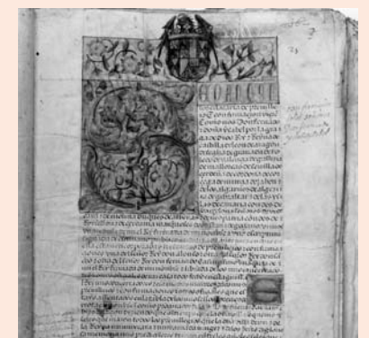
Documento del Archivo de Hondarribia

Archivo Municipal de Hondarribia relativa a los años 1186-1479 (nº 48) y 1480-1498 (nº 64).