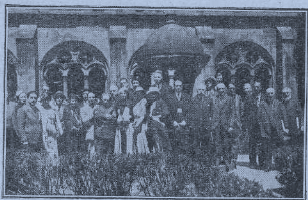
Los miembros del Congreso en el Claustro de San Telmo.