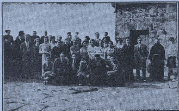
Grupo de concurrentes a los Cursos de 1934 en el Mirador del Castillo.