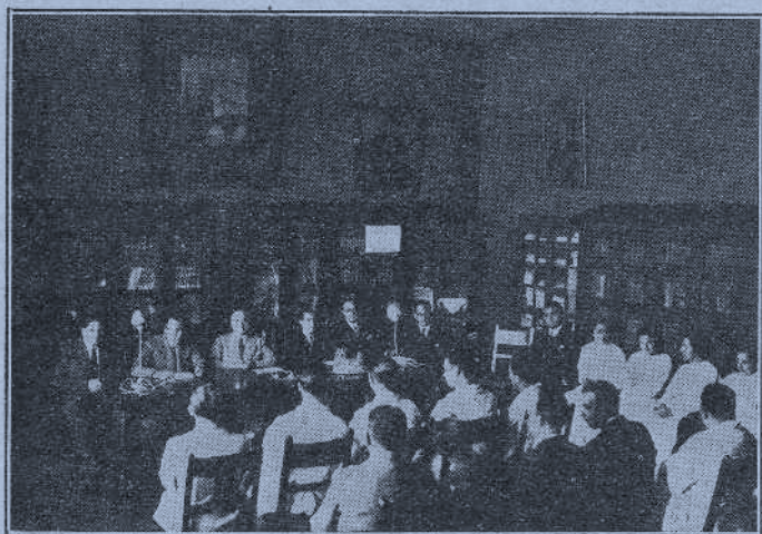
Acto inaugural de la II Asamblea del Hospital Civil de Bilbao.

El sábado día 15 se celebraron los anunciados exámenes para la concesión de certificados de conocimiento de la lengua vasca, en igual forma que los celebrados en San Sebastián y figurando en el tribunal una representación de los profesores vizcaínos, siendo los resultados tan satisfactorios respecto a los alumnos