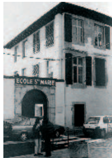
St. Joseph eta St. Marie izan ziren Iratzedarren lehen eskolak

Udazkenez, 1930eko urrian, Uztaritzeko ikastetxera eraman zuten gurasoek, bere anaia zaharragoekin batera. Uztaritzen egin zuen, bada, 1930-1931 ikasturtea. Hurrengo urtean, Donibanera itzuli zen berriro eta han egin zituen bi ikasturte jarraian, 1931-1932koa eta 1932-1933koa. Beraz, Donibane Lohizuneko eskolan lortu zuen ikasketa ziurtagiria, «frantses eskoletako zertifikata».