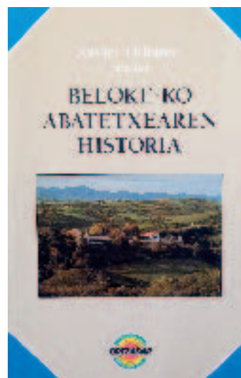
Usterik gutxienean, Belokeko monastegira sartu zen fraile beneditar 1941ean. Eta hango historia idatzi du