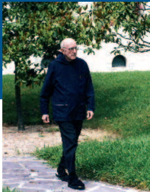
Belokeko monastegitik askotan atera behar izaten zuen kanpoko zereginetara

Euskal Herriko zeru ez-tian, hodei beltzak bildu dira;