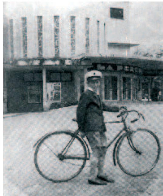
Donibane Lohizuneko karrikan txirrianduan 10 urterekin