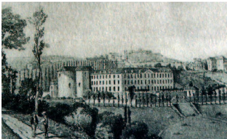
Larresoron egin zituen apez izateko lehen ikasketak