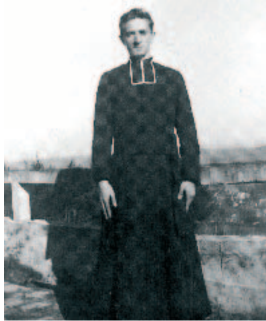
Uztaritzeko ikastegian apezgai, 1937an

Eliza honetan erne zitzaion Iratzederri kristau fedea