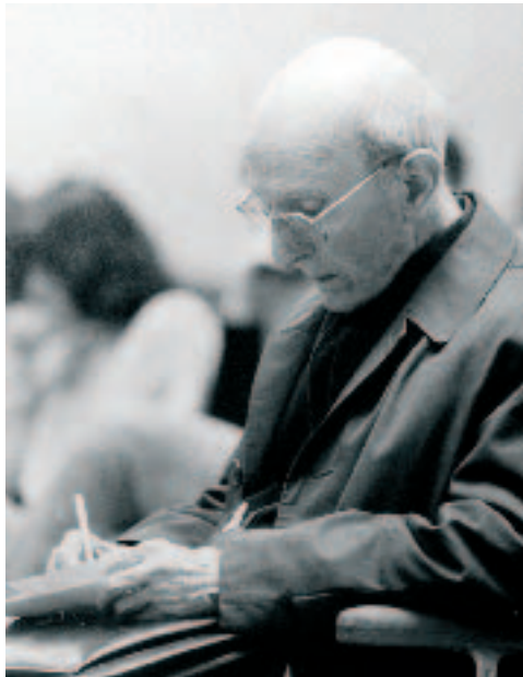
Donostiako EUTG ikastetxean Herri Literatura II. jardunaldian, 1992an