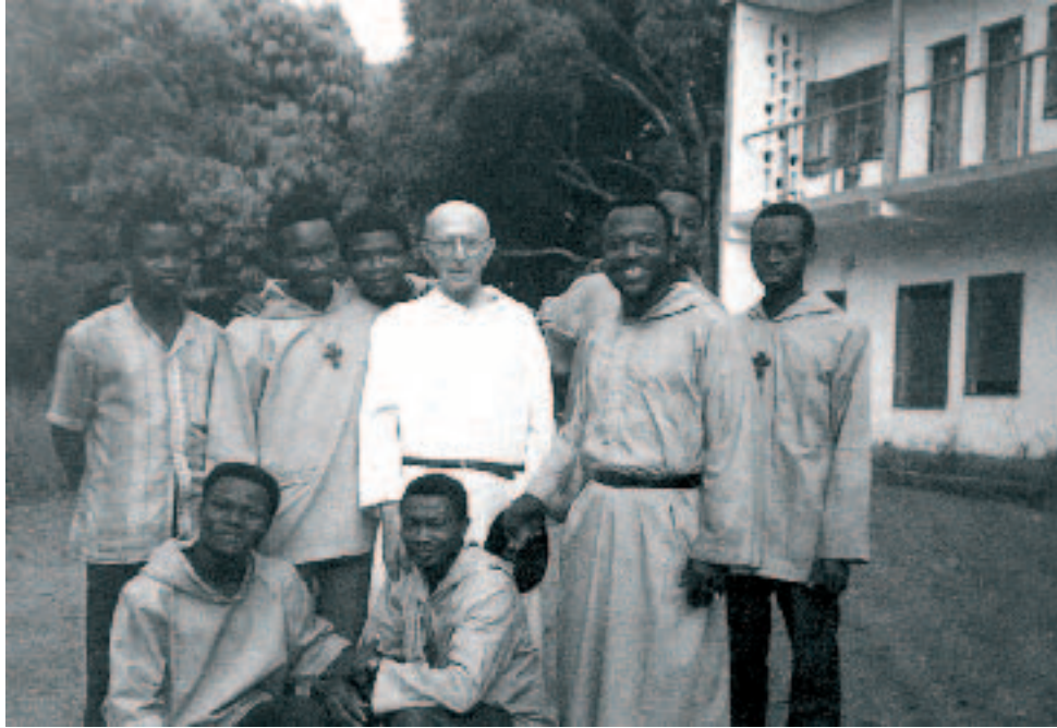
Zagnanadoko frailegaiei azken agurra egiten, 1988