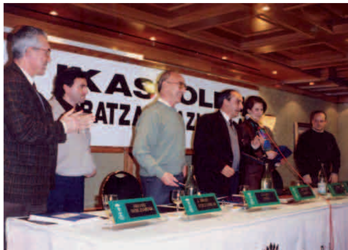
Ikastolen Batzar Nazionala, 1992an