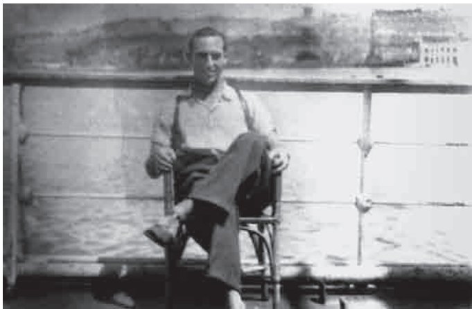
Venezuelatik Santurtziko portura eraman zuen itsasontzian, 1946an

zuen lana, Kolonbiako Santander probintziako San Gil herrian, elizaren babeseko aldizkari batean. Baina urtebete inguru besterik ez zuen egin han.