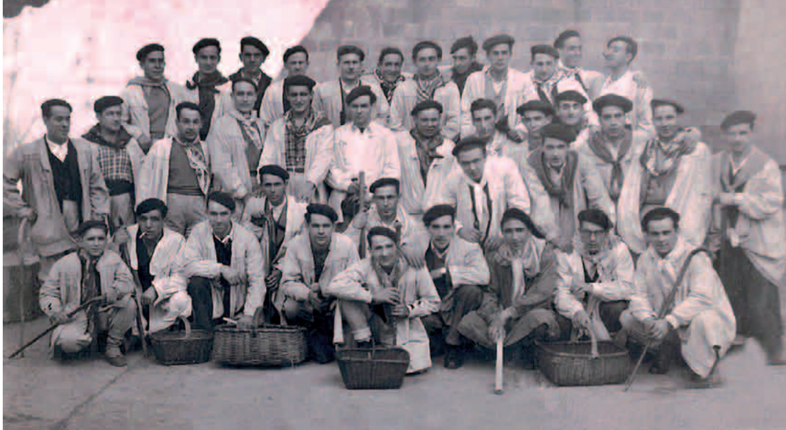
Agate Deuna bezperan, Elorrion. Atxa, goiko ilaran, eskuinetik bigarrena