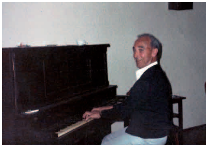
Pianoa jotzen, gaztetan Ameriketara eraman zuen itsasontzian bezala

Egun berean abiatu ziren biak Caracase- tik, bata New Yorkerantz eta bestea etxe- rantz. 1946ko urriaren 1ean heldu zen Santurtziko portura. Elorrio hartu zuen bizileku, etxekoekin, aita lanera hara jo- na zenez.