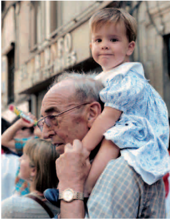
Ainhoa bilobarekin, San Ferminetan

2007ko urriaren 23an hil zen, 87 urterekin, gaixoaldi luze baten ondoren. Emaztea, lau seme-alaba eta zazpi biloba utzi zituen.