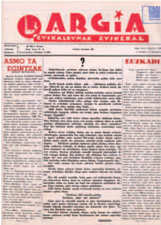
Argia aldizkariaren 13. eta 14. zenbakien azalak

dekoa —hamasei orrialde izatera heldu zen gerora—. Mantxetan bertan zetorren aldizkari jaio berriaren asmo nagusia zein zen: Argia [letra handian] Euskaldunak euskeraz [txikiagoan]. Lehenengo zenbakiko azalean, «Asmo ta Egintzak» idatzi si-nadurarik gabean, aldizkariaren helburua hizkuntzaren alorrera ez zela mugatzen argi utzi zuten sortzaileek: