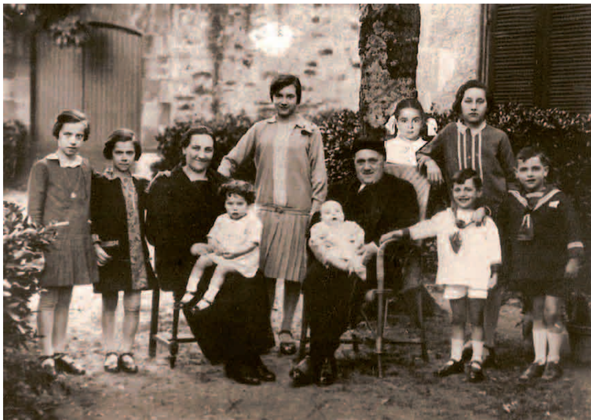
Jaunartze egunean marinel jantzian —eskuinetik lehena—, gurasoekin eta anai-arrebekin, Aretxabaletan