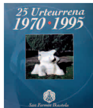
Iruñeko San Fermin ikastolaren eta Jaso ikastolaren historiari buruzko liburuen azalak

Hamalau urte egin zituen, beraz, Atxa Jaunak San Fermin ikastolako zuzendari. 270 ikasleko ikastetxea zela hartu zuen ardura Atxak, eta mila ikasle inguru zituela utzi zuen, egoitza propioarekin eta euskarazko batxilergoa ere martxan, 1979tik. Gainera, Arturo Kanpion akademiaren (1974), Blanca de Navarra ikastolaren (1976) eta Francisco de Jaso ikastolaren (1980) sorburuan izan zen San Fermin ikastola, Atxa zuzendari izan zen garaian.