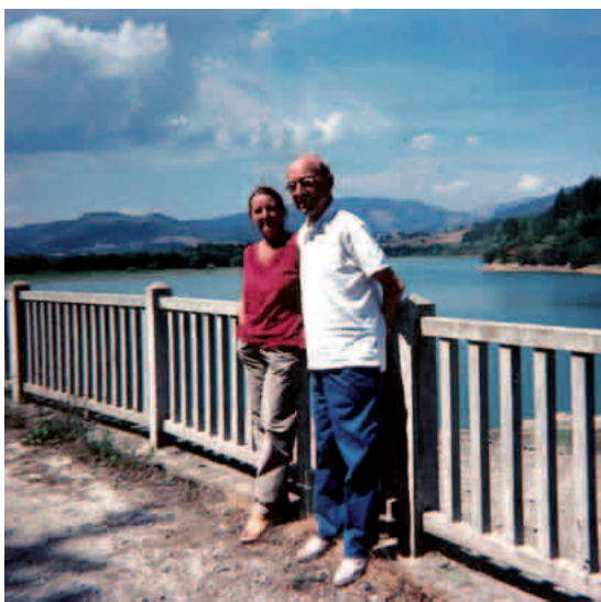
Aretxabaleta inguruko txokoak gogoko zituen. Urkulu urtegian, 2003an