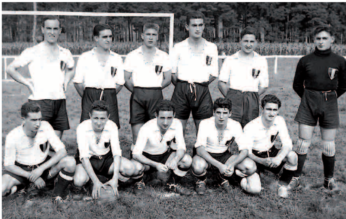
Elorrioko futbol taldean. Zutik, lehenengoa ezker aldean