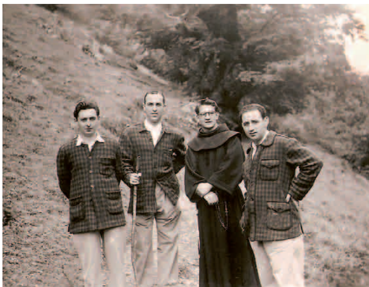
Ezkerretik bigarrena, mendira lagunekin egindako irteeratako batean

-betea. Luistarren Elorrioko etxean berrogeita hamar mutiko bildu, Santa Ageda eguneko abestiak erakutsi eta baserriz baserri kantari ibiltzea, aurrerapausoa zen garai ilun haietan. Carlos Murgiak Discos