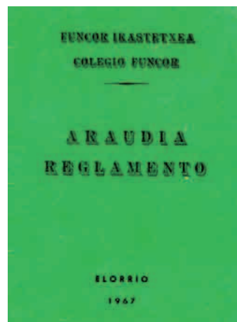
Funcor kooperatibako ikastetxearen barne araudia