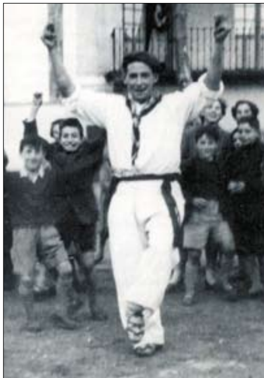
Dantzarako afizio handia zuen gaztetatik. Altuera zela eta, dantza lotuan aritzeak lotsa ematen ziola aitortu zuen behin baino gehiagotan

gogoko bere izaeraren alde hori —«askotan egon izan nauk gero “hori ez nioan esan behar pentsatzen”. Baina esan eta gero»—, baina askoz gehiago gorrotatzen zuen, apaltasuna maite zuen bezainbeste, zurikeria: «Aurrean zurikerian eta alde egin egindakoan ikaragarriak esaten beragatik, hori etzaidak behin ere gustatu