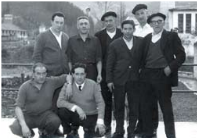
1965. urtean, umetan bertsotarako grina piztu zion Uztapideren ondoan

tzea. Besteak beste, bertsotan aritzea gaizki ikusita zegoela gogoratu zuen hainbat elkarriketatan, eta etxekoak ez zituela bereziki pozten gaztetxoarengan indarra hartzen ari zen afizio hark. Hamalau urte zituela aritu zen jendaurrean bertsotan elizaurrean egiten zituzten antzerki modukoetan, baina berak bertso-saiotzat hartzen zuen aurrenekoa Legorretan kokatzen zuen, Corpus egun batez, artean hamazazpi urte bete gabea zela. Hamazazpi zituen ikusle joan eta, Lazkaon bertan, San Prudentzio jaietan, Juan Jose Lujanbio Saiburu hernaniarrarekin eta Iñaki Eizmendi Basarri Errezilen sortutako zarautzarrarekin batera aritu zedin atera zutenean. Lazkaomendin ona