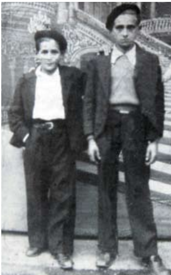
Beasaingo jaietan lagun batekin, 1941ean

eskolarako egindako lanen kontura. Beti izan zuen eskolan gutxi ibili izanaren pena, baina ez zitzaion horretarako abagunerik aproposena egokitu: baserrian guztientzako lana egoteaz gain, 1936ko matxinadak eta haren ondorengo gerrak ikasketak eten zizkioten.