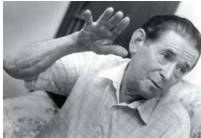
Bihotzak egin zion azkenean huts

baserri mundutik. Izan ere, samurtasunez kantatu izan zion beti baserriari, baserrien eta baserritarren etorkizunari buruz kezkatu azaltzeari uko egin gabe. Aukera izan zuenean, 1973an, Gurutzeta baserria erosi zuen Zaldibin, sozio batekin erdibana. Txerrikumeak hazten hasi ziren, behi-azienda jarri zuten gero, eta 1986an bete zuen ametsa, baserriaren jabe bakar egin zenean. Ilusio handiz, goitik behera berritu zuen baserria, dotore jarri zuen etxea. Zoritxarrez, ezin izan zuen nahi beste gozatu bizitza osoan amestutakoa.