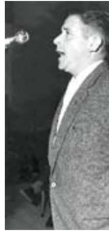
1967. urtean, Donostian jokatu zen Euskal Herriko txapelketan. Hortxe utzi zion txapelen bila ibiltzeari

zion aurea. Gipuzkoako bigarren izan eta egun gutxira, abenduaren 30ean, Euskal Herriko bertsolari ezagunenekin lehiatu zen Lazkao Txiki txapelketa nagusian, eta laugarren gelditu, Uztapide, Basarri eta Xalbadorren ondotik.