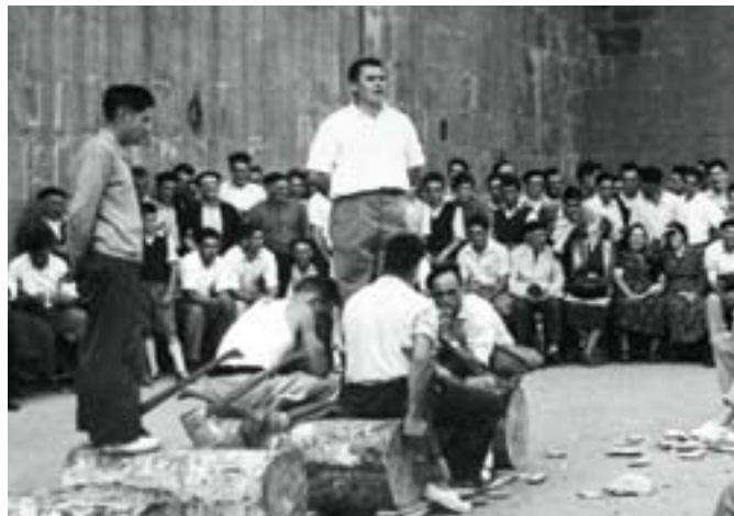
1950.era bazebilen herriz herri eta bigarren mailako txapelketetan

tzea. Besteak beste, bertsotan aritzea gaizki ikusita zegoela gogoratu zuen hainbat elkarriketatan, eta etxekoak ez zituela bereziki pozten gaztetxoarengan indarra hartzen ari zen afizio hark. Hamalau urte zituela aritu zen jendaurrean bertsotan elizaurrean egiten zituzten antzerki modukoetan, baina berak bertso-saiotzat hartzen zuen aurrenekoa Legorretan kokatzen zuen, Corpus egun batez, artean hamazazpi urte bete gabea zela. Hamazazpi zituen ikusle joan eta, Lazkaon bertan, San Prudentzio jaietan, Juan Jose Lujanbio Saiburu hernaniarrarekin eta Iñaki Eizmendi Basarri Errezilen sortutako zarautzarrarekin batera aritu zedin atera zutenean. Lazkaomendin ona