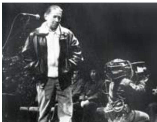
Jendaurreko azkeneko bertsoa, 1993ko urtarrilaren 23an