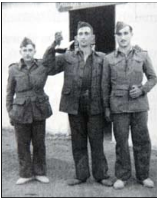
Tetuanen. Orduan ere, gainerakoak baino txikixeago...

Aurpegian astebete iraun zion bibote eta guzti itzuli zen, 23 urteko gizon gazte, soldadutzatik. Zain zeukan bereziki erakartzen ez zuen igeltsero lana, eta hartan jardun zuen beste hamar urtez, harrik eta 1958an Lazkaon sortu berria zen Fundiciones Arriaran lantegian hasi zen arte. Bazebilen ordurako bertsotan, poliki ibili ere, baina beste nonbaitetik atera behar zuen bizimodua, eta ez zeukanez