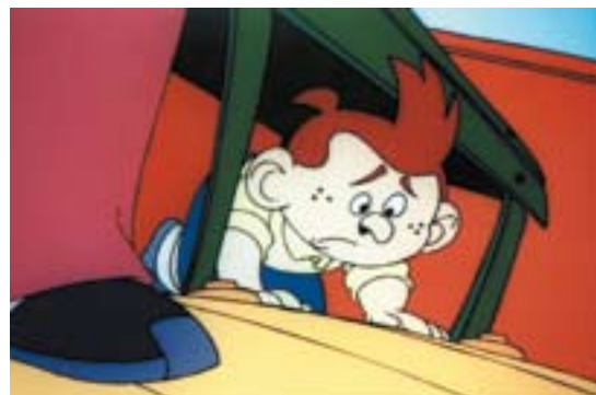
Marrazki bizidunei esker, gaztetxoek ere izan zuten Lazkao Txikiren berri