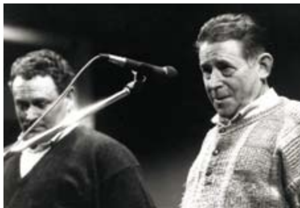
«Eskatzen didatena eman beharrak erre nau», aitortu zuen 1987an egindako elkarrizketa batean