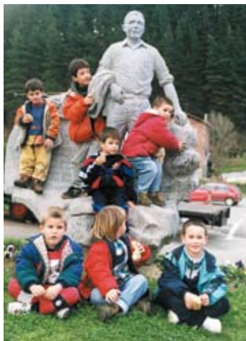
Omenaldirik goxoena, umeak inguruan jolasean izatea

Alaia. Hori ere bazuen ageriko nortasunaren zati. Bere ispiluan besterik ikusten zuen, ordea. «Alaia ni? Etzazula pentsa. Hori ez da izaten kanpotik ageri den bezala. Azaletik ez da ikusten pertsona baten izakera. Barruan izan litezke kezakak. Erderaz esaten da negar ez egiteagatik parre asko egiten dala. Horiek askotan pasatzen dira bizimodu honetan.» Txikitasunaren gaia bezala, bertsoan ere maiz landu zuen alaitasunarena, eta bide bertsutik beti: