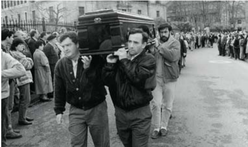
Milaka lagun bildu ziren Lazkaon Lazkao Txikiri agur esateko

bai, makal ibili arren. Lazkao Txikiren ateraldiak sailkatzekotan, bi jarri behar dira aipatuenen buruan. «Jaiio Lazkaon, hazi inon ere ez» erantzun zueneko, eta operatu aurretik anestesia jarri behar zion medikuari esana: «Zuk lo jarriko nauzu, baina nork jarriko du despertadorea?».