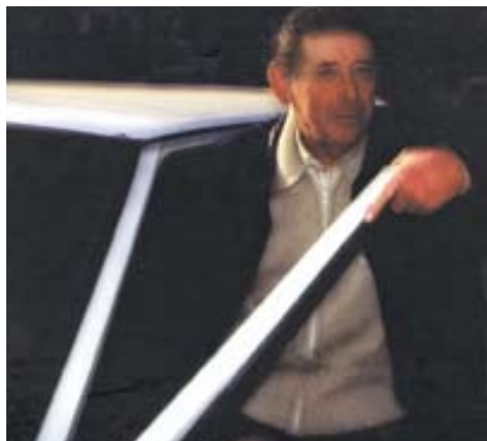
Makina bat kilometro egin zuen pentsu-saltzaile, baina ez omen zuen lanbide horretarako balio. Finegia zen, alegia

Aurpegian astebete iraun zion bibote eta guzti itzuli zen, 23 urteko gizon gazte, soldadutzatik. Zain zeukan bereziki erakartzen ez zuen igeltsero lana, eta hartan jardun zuen beste hamar urtez, harrik eta 1958an Lazkaon sortu berria zen Fundiciones Arriaran lantegian hasi zen arte. Bazebilen ordurako bertsotan, poliki ibili ere, baina beste nonbaitetik atera behar zuen bizimodua, eta ez zeukanez