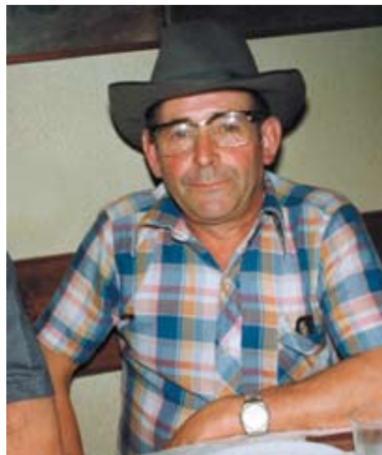
Bazkal eta afalondoak ondo animatzen bazituen ere, ez zeukan bere burua txiste kontalaritzat