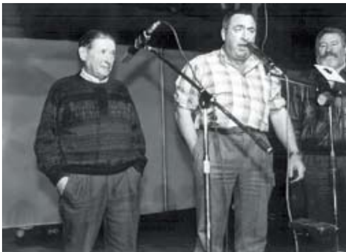
Mañukortarekin bertsotan. Adar-jotzaile finak biak, bakoitza bere estiloan

Ni nola naizen aitortutzea askozaz ere hobe da, triste egon arren alai itxuran beti ibili norbera, eta pentsatu holaxen dala Txiki honen izaera: Pena guztiak barruan gorde ta umorea atera.