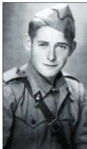
Afrikara bidali zuten soldadu bi urterako 1947an

zuen ekarriko Iztueta gatz eta piperdunak Afrikako egonalditik! Asko, pentsatze-koa denez, altueraren ingurukoak. «Talla horrekin joan behar al duk soldadu?», galdetu omen zion batek. Eta berak erantzun: «Honekin joan beharko diat, besterik etzeukeat-eta». Galtza-barrenak arrastaka ez eramateko bueltak eta bueltak eman behar izaten zizkion soldadu-buzoari, eta telemetroarekin «apuntadore» lana egitea egokitzen zitzaionean hanka-puntetan ibili behar zuen, zentimetro batzuk ematen zizkieten botak jantzi beharrean oinetan apretak zituenean... Edonola ere, ez zen gaizki moldatu.