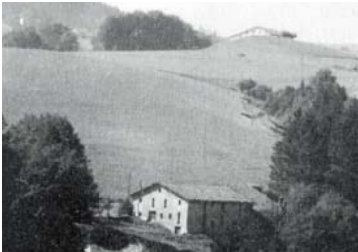
Zaldibiko Gurutzetan gauzatu zuen baserri baten jabe izateko ametsa

baserri mundutik. Izan ere, samurtasunez kantatu izan zion beti baserriari, baserrien eta baserritarren etorkizunari buruz kezkatu azaltzeari uko egin gabe. Aukera izan zuenean, 1973an, Gurutzeta baserria erosi zuen Zaldibin, sozio batekin erdibana. Txerrikumeak hazten hasi ziren, behi-azienda jarri zuten gero, eta 1986an bete zuen ametsa, baserriaren jabe bakar egin zenean. Ilusio handiz, goitik behera berritu zuen baserria, dotore jarri zuen etxea. Zoritxarrez, ezin izan zuen nahi beste gozatu bizitza osoan amestutakoa.