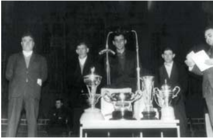
1962ko Euskal Herriko txapelketako finalean laugarren gelditu zen, Uztapide, Basarri eta Xalbadorren ondotik