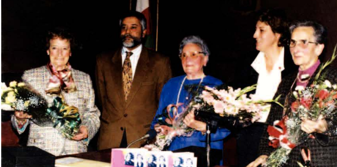
Azpeitian jaso zuten omenaldia

laren bultzatzaile, Urnietan bere fruituak utzitakoa da eta Euskal Herria bera bezalakoan lanei esker eraikia.