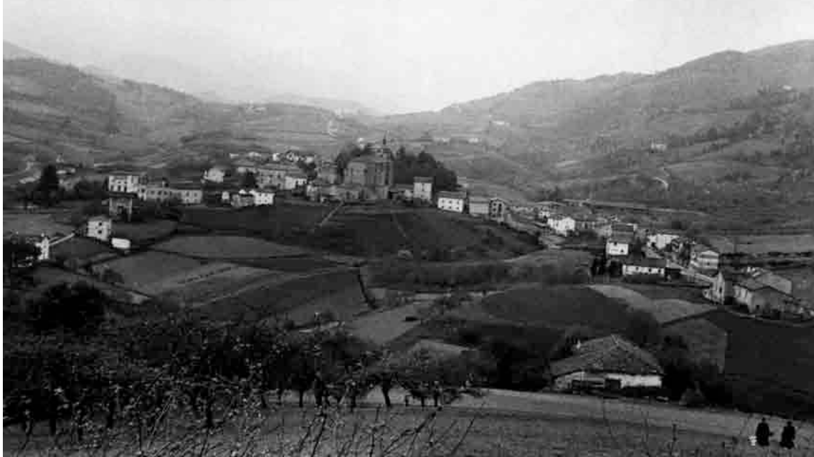
Urnieta herrigunea Langardatik ikusita (1954)