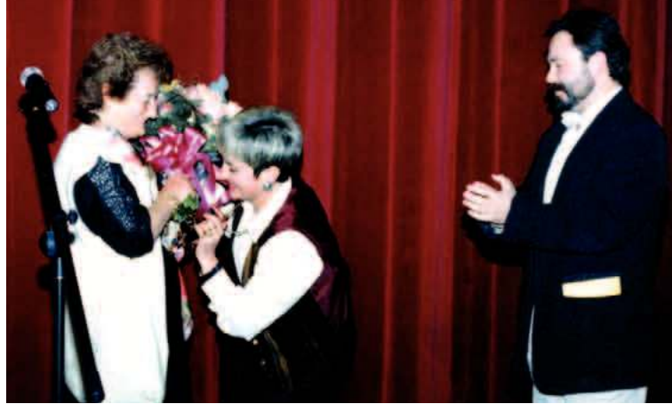
Urnietan jaso zuen omenaldia

ikasi gabea, baina balio zezakeela uste zutena.