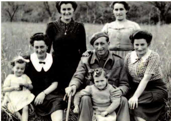
Erbestean zegoen anaiarentzat prestatutako familia argazkia

Arizmendi ahizpek ere jasan zuten faxisten indarra gazte izanik ere. Hirurak Andoainera joan eta ilea moztu zieten. «Etxera iritsi arte malkorik ez!», esan zien hirurei amak, eta baita hauek bete ere, hasierako momentu txarra pasata batere axola ez balitzaie bezala joan ziren Andoainera oinez, egunero agertu behar baitzuten bertan.