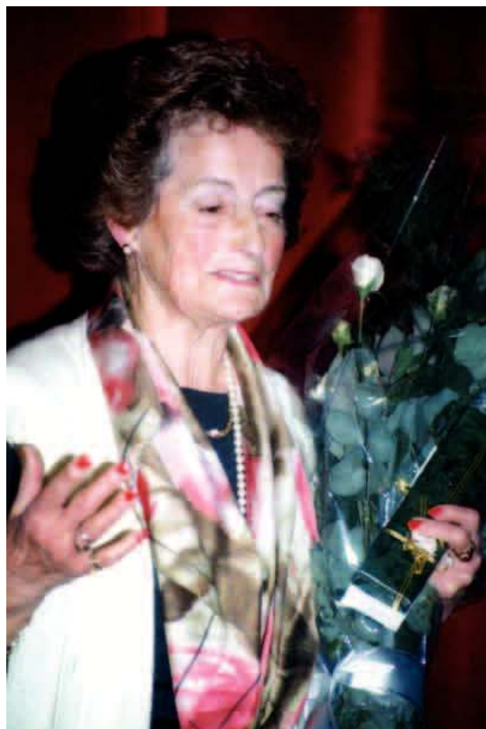
Urnietan jaso zuen omenaldia

Mariak ez zuen etxeakoandre izaerarik, etxeakoak eginda izaten zituen eta horrek bestelako zaletasun eta kezketan guztiz aritzeko aukera eskaintzen zion.