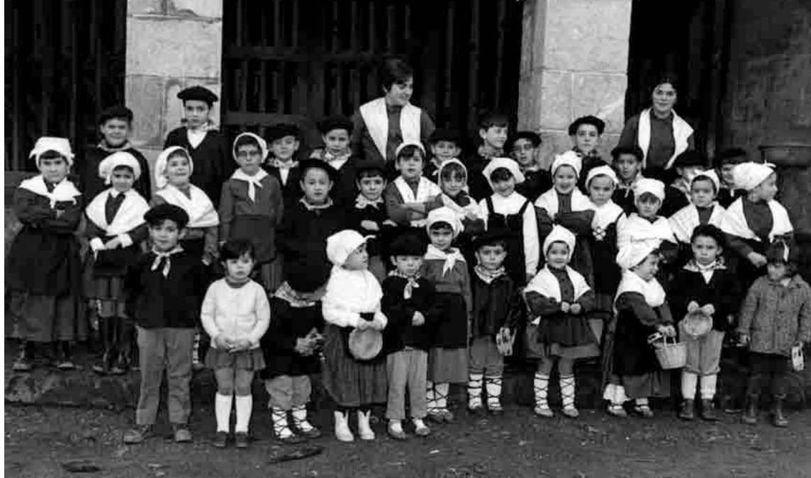
Egape ikastola 1969an