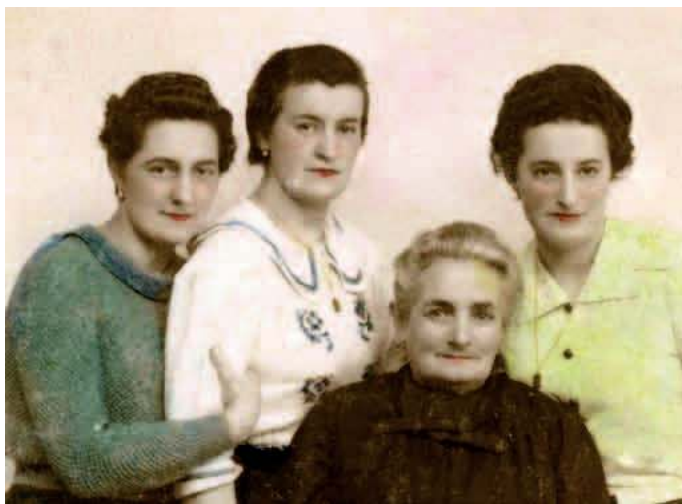
Hiru ahizpak amarekin