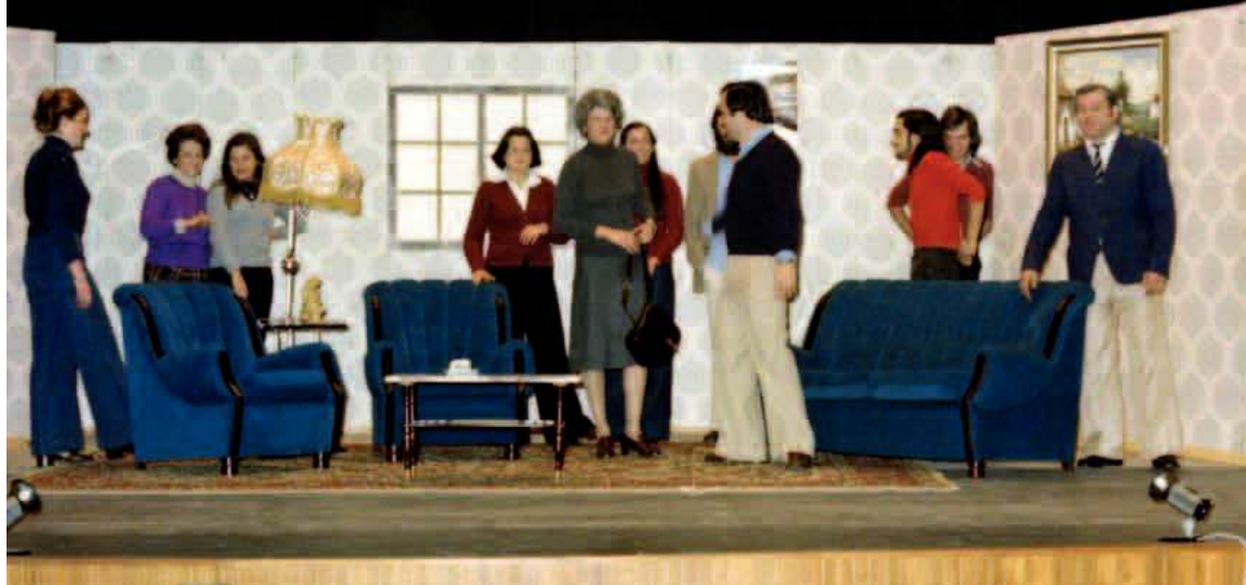
Egia Billako antzezle taldea