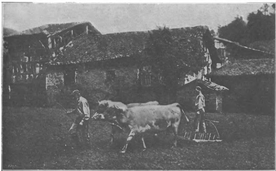
Fig. 2.—Zeanuri: caserío Alkibar.