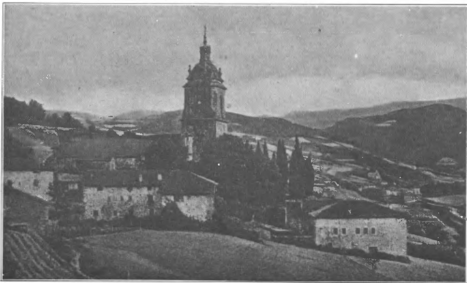
Fig. 1. —Zeanuri: iglesia y algunos caseríos.