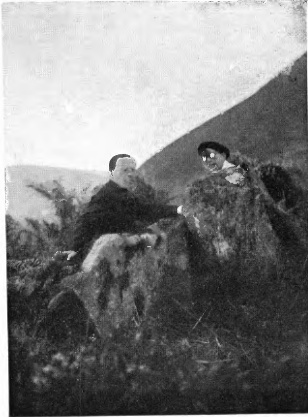
Dolmen del collado de Akola