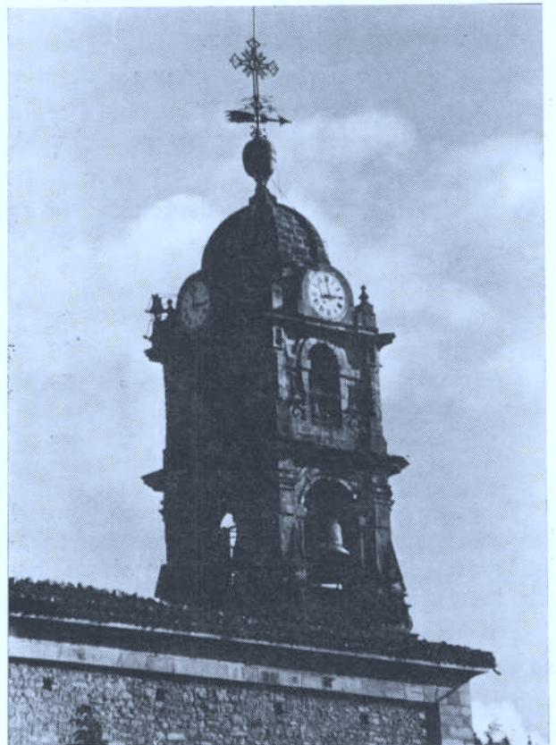
Santa Marinako dorrea.

Domeketan eta jaixetan meza aurretik iru aldiz