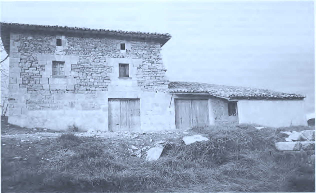
Casa antigua reutilizada como corral en Oleta.

Además de las marcas descritas en la pregunta nº 8 existe otro tipo de marca que no es de propiedad, que se le hace a la oveja recién parida después de haber amamantado a la cría. Consiste en frotarle la piel con un poco de estiércol para señalar que no había de darle otra vez.