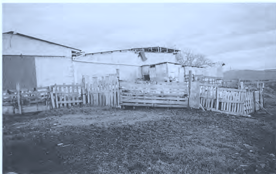
Barrera del corral de Villaveta.