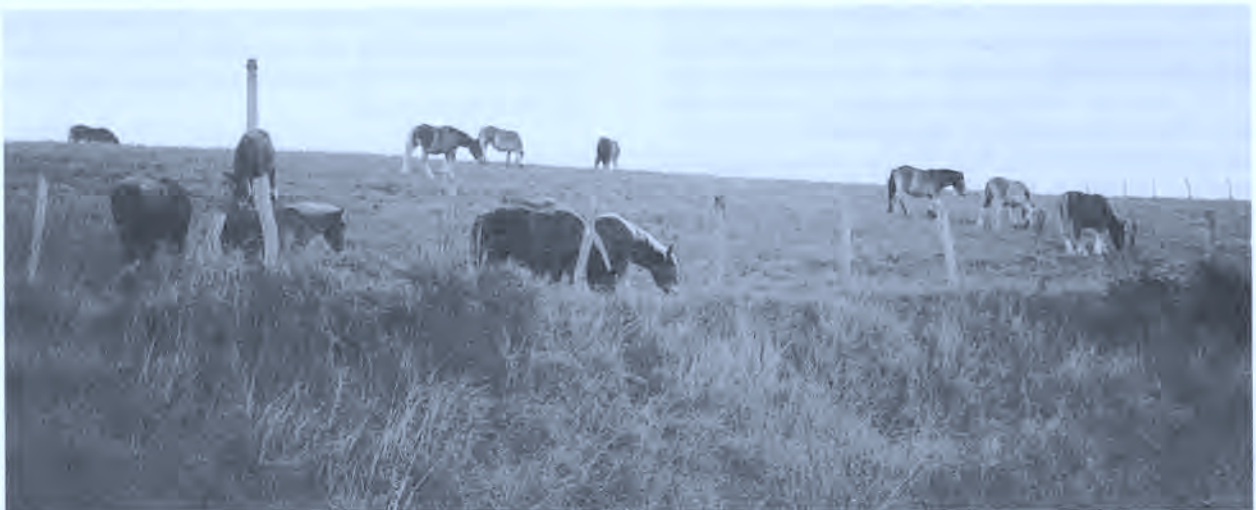
Caballos pastando en Ecay.

Los refugios para el ganado de esta zona reciben el nombre de bordas . Son edificaciones muy