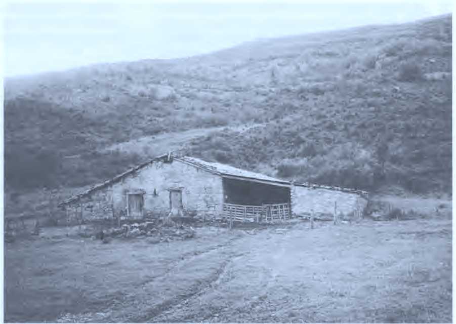
Corral-borda a los pies de la Sierra de Gongolaz.

sobre la choza? ¿Qué extensión tiene? ¿Cómo se pierde? ¿Quién lo hereda?