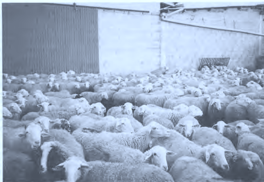
Marcas en las ovejas recién paridas.

sencillas, pequeñas, de piedra y madera, y tejado de losetas o tejas. Generalmente disponen de un espacio para el pastor y otro para las ovejas, pocas tienen camastro y chimenea.