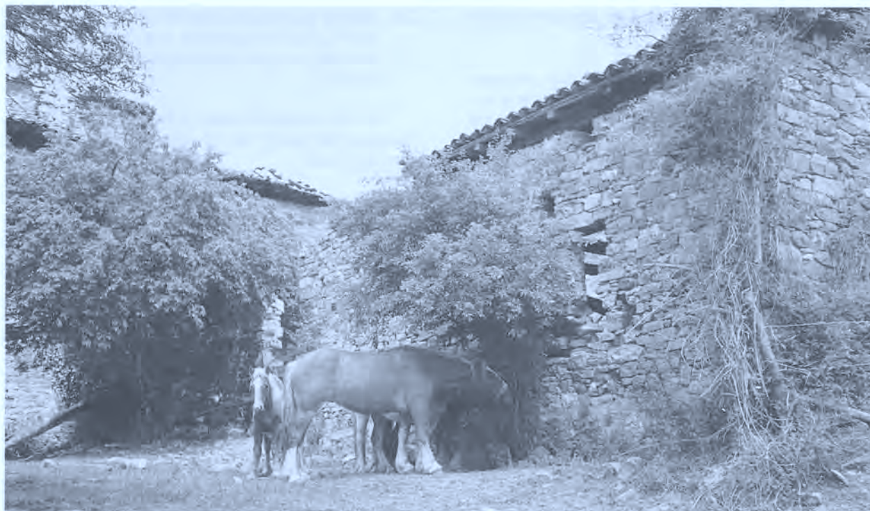
Caballos pastando en Gorriz. 1990.

en régimen de libertad, sin que los pastores permanezcan con ellos.