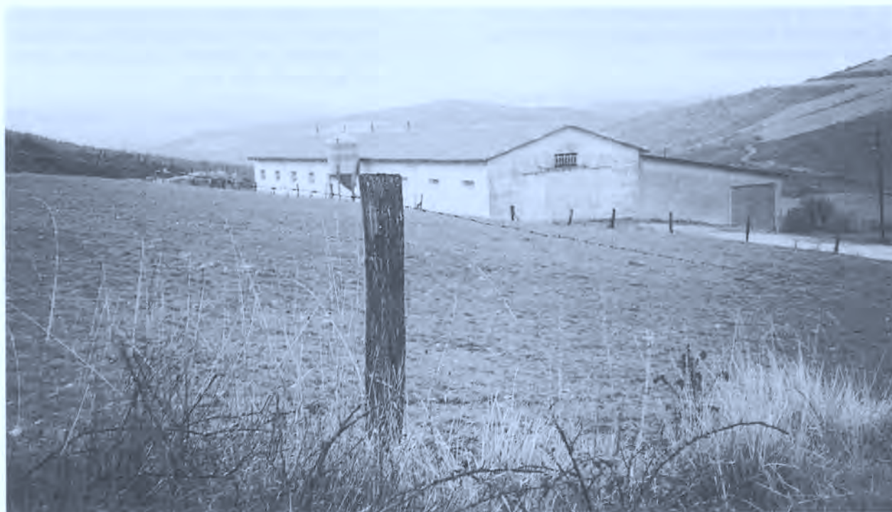
Redil y zona de pasto en Olaverri.

duro. Actualmente se les da estos mismos alimentos a los porcinos criados en la casa.