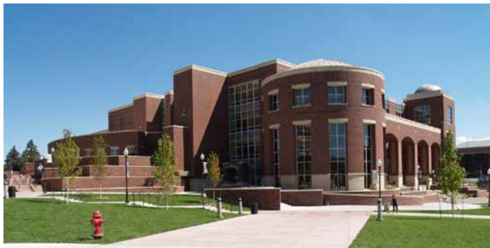
Center for Basque Studies, Mathewson-IGT Knowledge areto berrian

BCI-n egoteaz gain, CBS Press Scholarly Publishers Indicators (SPI) web orrian ere agertzen da, hots, gazteleraz idazten duten egile eta ikerlarien ingelesez argitaratutako liburu indize bakarra. Scholarly Publishers Indicators-ek erakusten duen moduan, 2014an CBS Press 248. postuan zegoen munduko argitaletxe onenen artean adituen arabera. 2018az geroztik CBS Press 87. postuan dago SPI-ko zerrendaren arabera ( http://ilia.cchs.csic.es/SPI/ ).