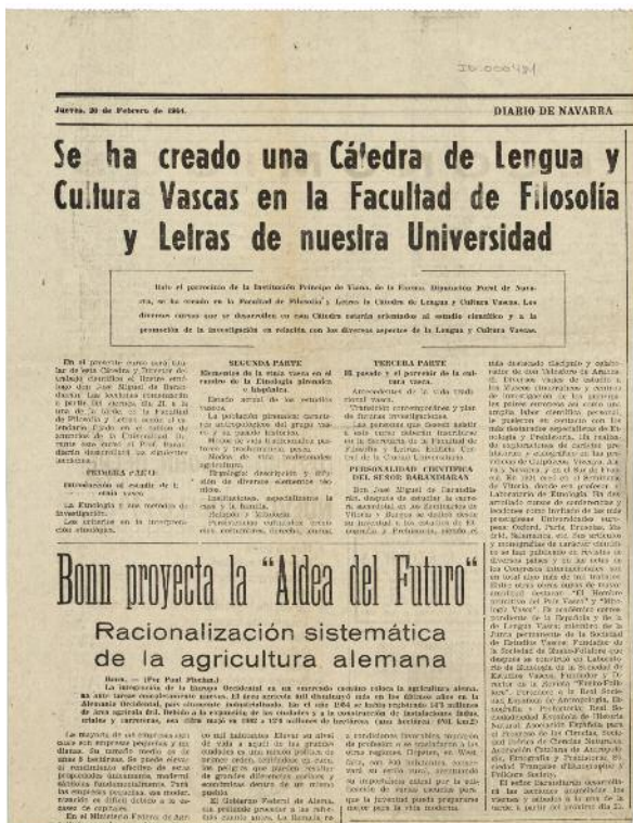
Nafarroako Unibertsitatean sortutako Euskal Hizkuntza eta Kulturari buruzko katedraren berri. Diario de Navarra, 1964.02.20

daudenak eta Eusko Folklore Urtekariaren bilakaeran zerikusi zuzena eta esanguratsua izango dutenak. Alde batetik, 1963an, Etnologiako Euskal Katedra ("Euskal Hizkuntza eta Kultura Katedra") sortu zen Nafarroako Unibertsitatean, eta Barandiaran bera izango da katedraren titularrak 1965 eta 1977 artean; eta, bigarrenik, katedra honen funtzioen osagarri gisa, Barandiaranek Etniker Plana ezarri zuen eta ikertzaile eta kolaboratzaile taldeak eratu zituen, bilketa etnografikoaren plan sistematikoa euskal lurralde osoan gauzatzeko helburuarekin, Euskal Herriko Atlas Etnografikoa osatzeko aldera. Une horretatik aurrera, hurrengo urteetako Eusko Folklore Urtekariak mugimendu horren isla izan beharko dute, eta bertan argitaratuko diren ikerketak plan zabalago baten parte izango dira: Euskal Herriko Atlas Etnografikoa egitea. Horixe bera izan zen On Jose Migelen mezua eta horrela egin da: "Datozen urteetako Eusko Folklore Urtekariak mugimendu honen isla zehatza izan beharko dute. Hala espero dugu" 13 .