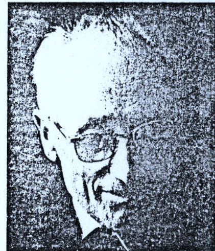
jose maria arizmendiarieta madariaga

Dn. José María, también hijo adoptivo de la villa, ha sido un Mondragonés más de corazón y de hecho. Aquí ha dejado su vida que se ha consumido a lo largo de 35 años de trabajo y de vida ejemplar.