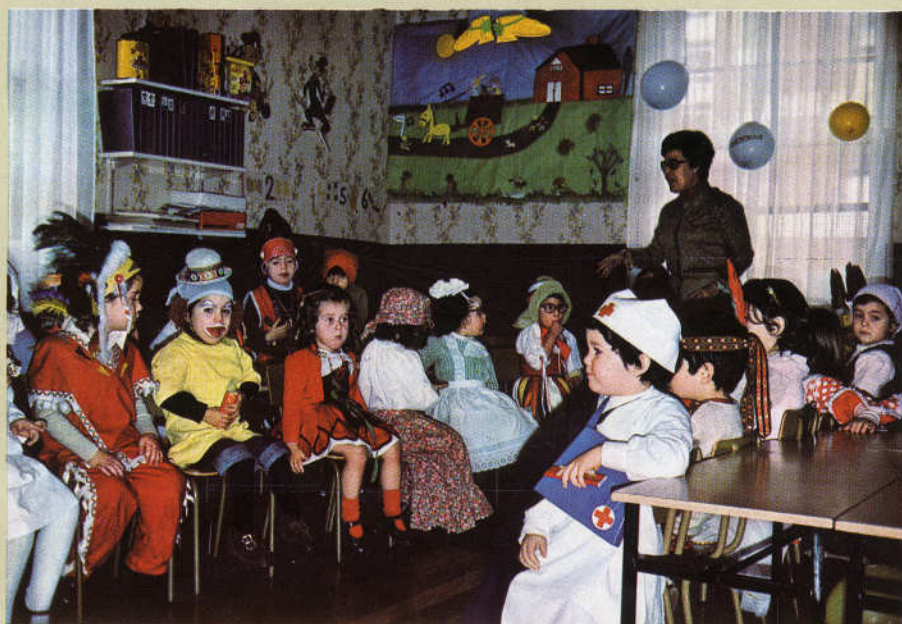
¿Los vemos como son, o recubiertos por un disfraz?

En fin: hay muchas cosas que parece que las conocemos de sobra y resulta que, cuando escuchamos a los expertos, nos damos cuenta de que no teníamos ni idea... Ya lo verán ustedes.