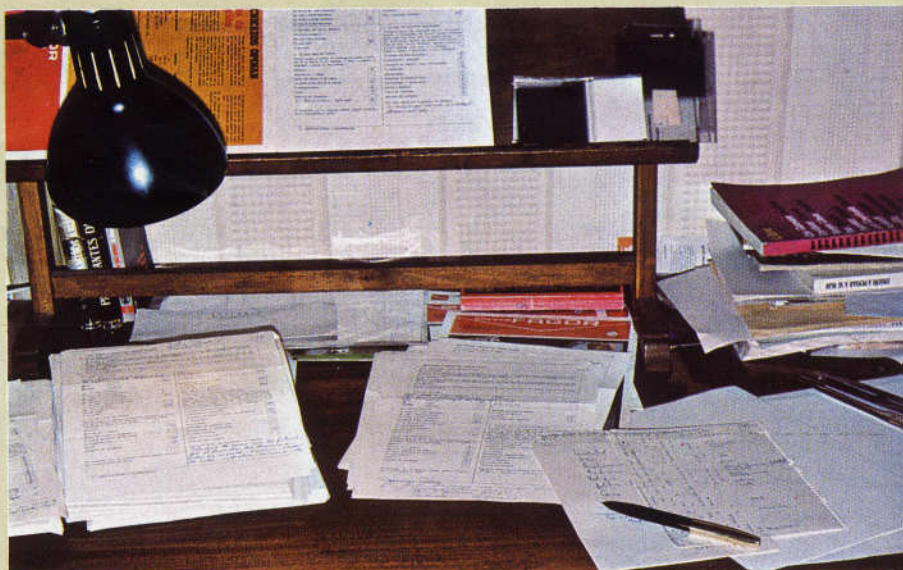
La mesa de nuestro redactor, invadida por la encuesta

En la mesa del redactor se han ido acumulando día tras día las encuestas formando verdaderas torres de papel que amenazaban monopolizar todo su interés. Todas ellas, sin embargo, han sido revisadas y anotadas con la esperanza de que a través de esas advertencias