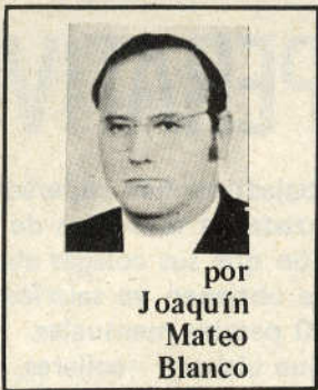
por Joaquín Mateo Blanco