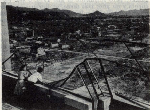
Esto es lo que quedó después del bombardeo atómico de Hiroshima, en el Valle de la Fe.

Hoy sobre las ruinas del antiguo templo se ha levantado una iglesia nueva y 10.000 católicos glorifican a Dios en el Valle de la Fe.