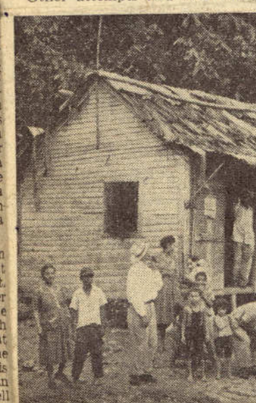
A few minutes from the city centre "tens of thousands of fiercely painted wooden shacks."

to simulate a homely American atmosphere. For example a row of gambling machines had been placed at the end of the open-air restaurant, and persons who had perhaps been engaged specially to do this—they were certainly not hotel guests—jerked and crashed the handles of these all through the dinner, and through most of the night.