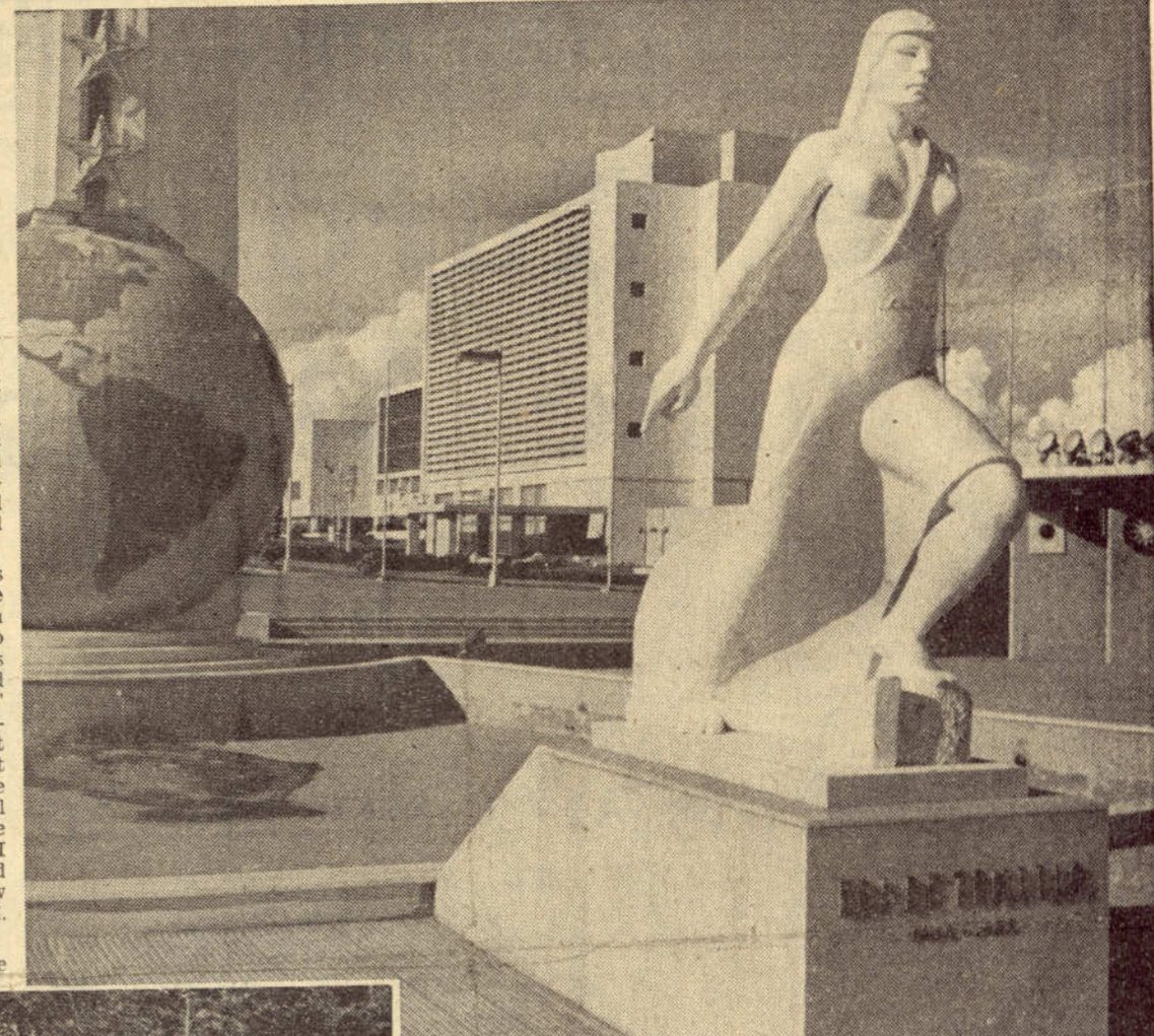
Ciudad Trujillo is "a tidy and bloodless edition of a Miami suburb... with rather flavourless prosperity."

In a few small, painted towns a grotesque doll-house architecture has weathered the hurricanes, and in the evening the marriageable girls put on their lavender plastic macintoshes and sit on their doorsteps all along the streets to see the world go by. The most substantial building in all these towns is the police headquarters (every one passing them must stop for the diver to announce his name and destination) and the central feature is always a monument raised by