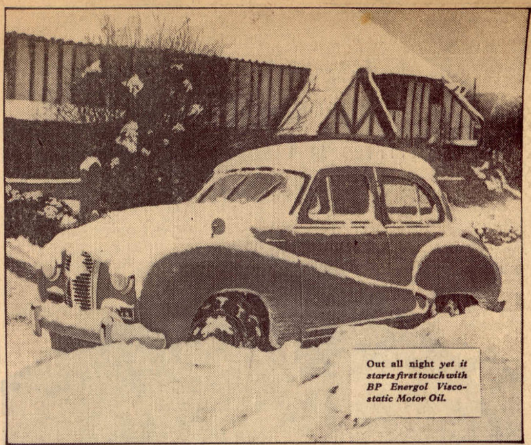
Out all night yet it starts first touch with BP Energol Visco-static Motor Oil.