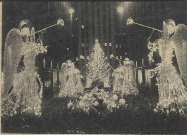
Rockefeller Center, vestido de luz y color, en las fiestas de Navidad