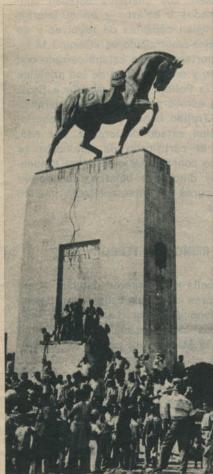
El fin de la gloria. Un tractor fue preciso para derribarlo del caballo.