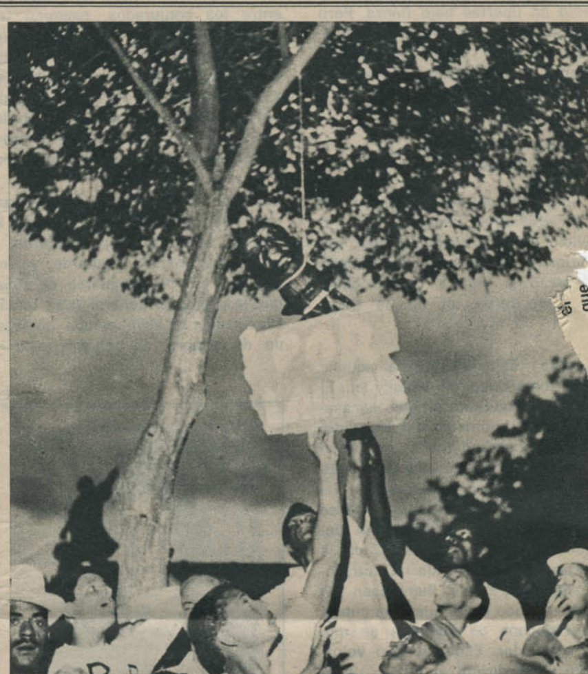
La cabeza en bronce del dictador es ahorcada por los dominicanos.