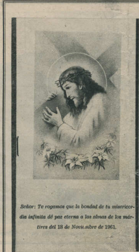
Señor: Te rogamos que la bondad de tu misericordia infinita dé paz eterna a las almas de los mártires del 18 de Noviembre de 1961.

«El día fijado para la ejecución, Ramfis salió de su casa acompañado por