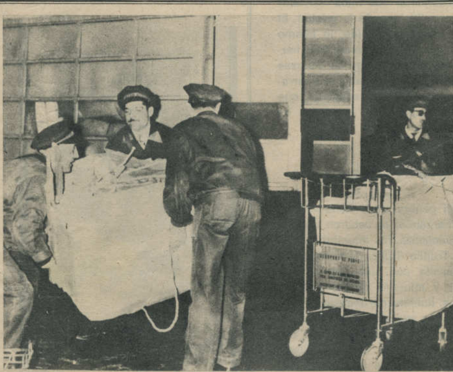
Los restos de Trujillo llegan a París, en su último viaje.

nos, eran llevados para someterlos a brutales interrogatorios; cuando se les devolvía, inconscientes, a las celdas, estaban irreconocibles.