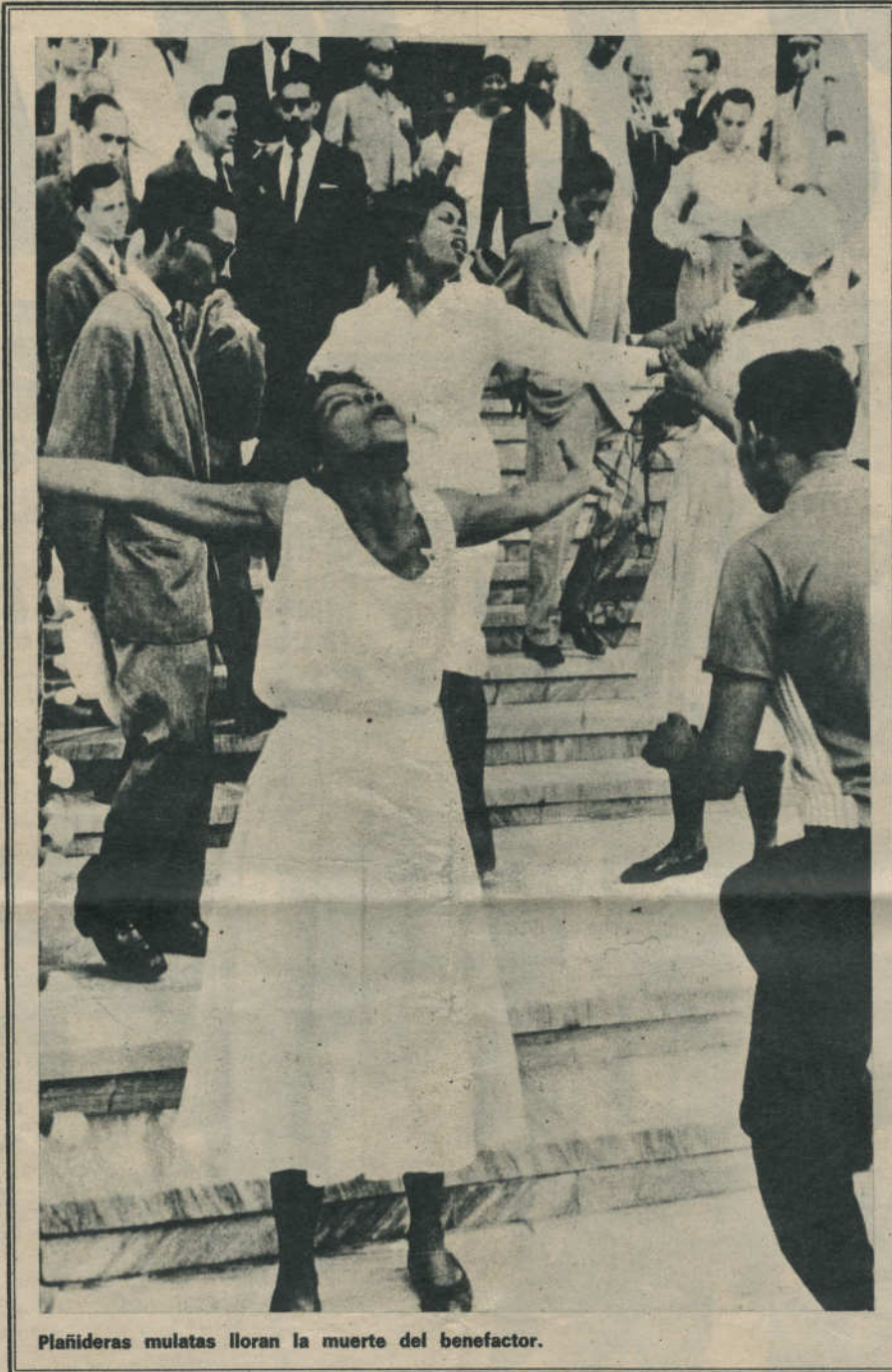
Plañideras mulatas lloran la muerte del benefactor.

Cuando llegó a Santo Domingo tenía veinticuatro años. Fue profesor de la Escuela del Servicio Diplomático y asesor del Departamento de Trabajo. Siete años más tarde, en 1946, emigraba a Nueva York. La guerra mundial había terminado y los exiliados creían que el régimen español —condenado por los Estados Unidos, Francia, la Gran Bretaña y la Unión Soviética— iba a derrumbarse de un momento a otro; en las montañas de Galicia, los Pirineos, Aragón y Andalucía, operaban «maquis» que se infiltraban desde Francia; en las ciudades escaseaban los víveres y el carbón, y las potencias vencedoras habían decretado el aislamiento diplomático de España. Jesús de Galíndez se convirtió en representante del llamado Gobierno de Euzkadí en el exilio y comenzó a llevar una intensa vida