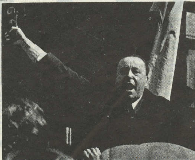
El energúmeno Blas Piñar, líder del grupo PENS (Partido Nacional Socialista Español), de la extrema derecha, cuyo portavoz es "Fuerza Nueva". Al fondo, en la foto, la bandera española. Blas Piñar está bien protegido aquí por los grises.