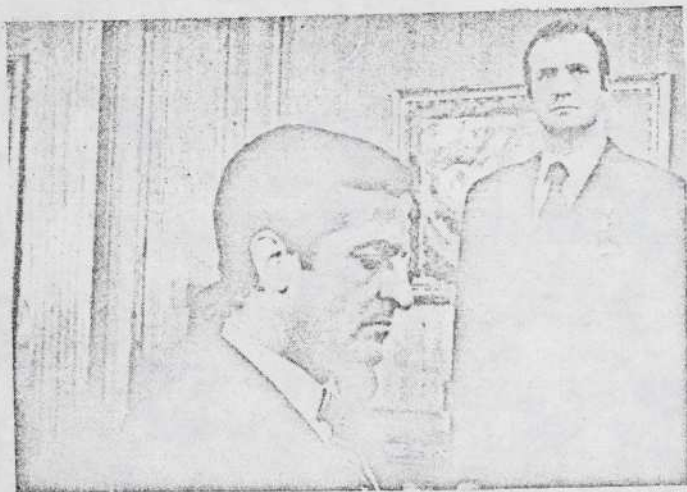
"No se trata, como ha dicho el Jefe del Gobierno a la revista 'Le Point', de que 'la izquierda se obstina e n combatir un pasado que ya no existe'. Ese derecho que tienen los españoles a intervenir en el debate, es lo que formará una opinión pública válida".

error como lo son ellos. Los que pueden traerlos al buen sentido, son los nombres de la oposición democrática. Están en su poder las dos condiciones inaispensables para desbaratar el tinglado de la farsa. Primero, uniéndose sobre un par de principios básicos, con lo que incrementan su fuerza, y entusiasman y polarizan a la oposición; segundo, gritando un NO rotundo a todo lo que no garantiza el libre ejercicio democrático para efectuar unas elecciones libres, con intervención en el gobierno de todas las fuerzas políticas representativas. El día que eso se logre, lo que ahora se llama realidad política del pueblo español, durará menos que un bizcocho en la puerta de una escuela.