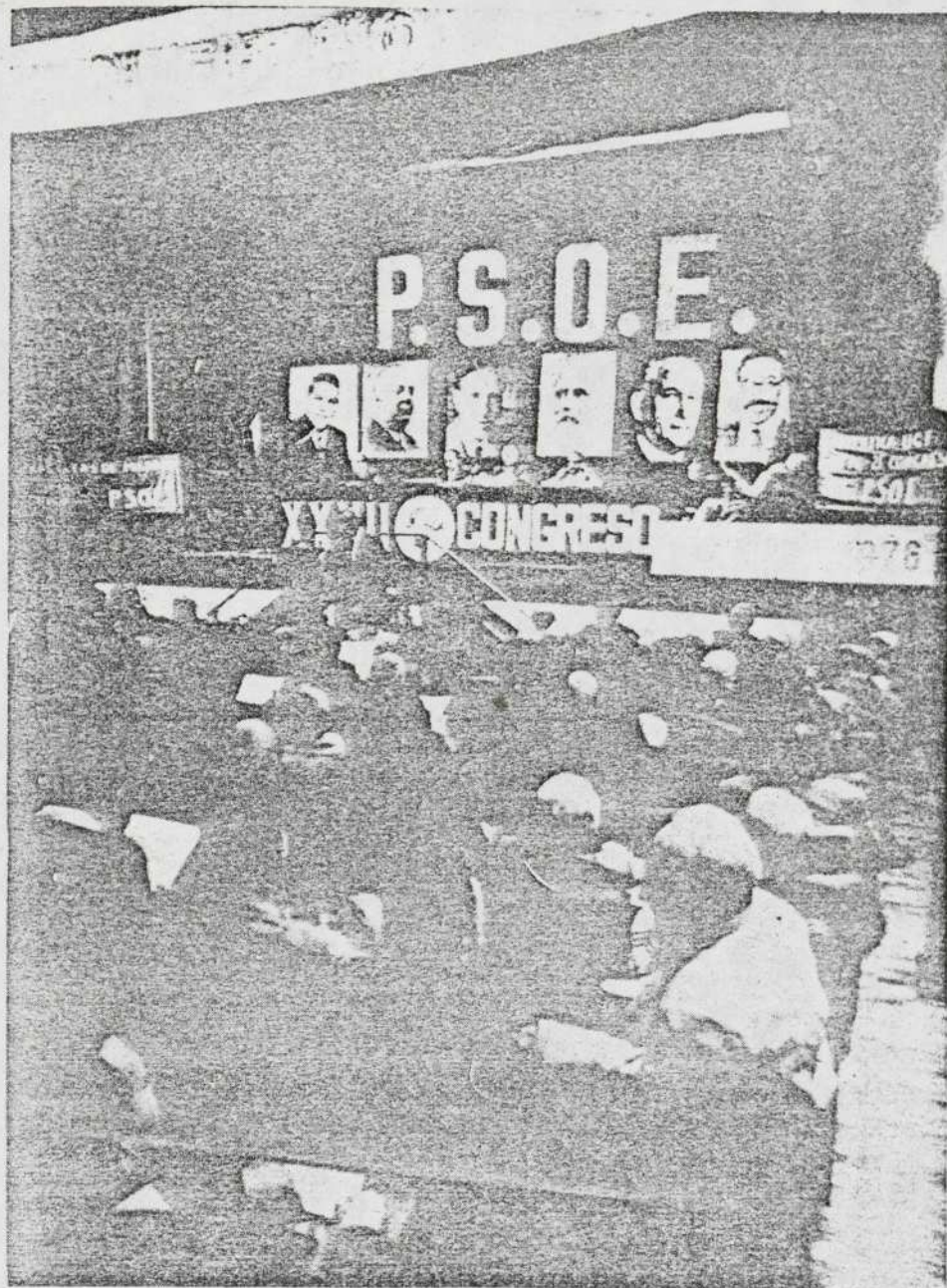
Efectivamente: puede verse en el último Congreso del PSOE (histórico) las fotografías murales de Pablo Iglesias, Largo Caballero, Besteiro, Fernando de los Ríos, Prieto y Trifón Gómez. (Falta el doctor Negrín).

Como Clemenceau, don Juan Negrín hizo la guerra. Ministro de Hacienda en el gobierno Largo Caballero, en el que era uno de los representantes de la tendencia del entonces su amigo Indalecio Prieto, tuvo que afrontar el envío del oro del Banco de España a la Unión Soviética. Ni la idea fue suya, ni el sitio elegido en aquellas dramáticas circunstancias podía ser