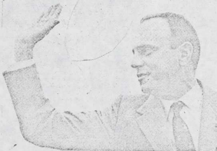
"Don Manuel Fraga, que parecía querer escaparse del lugar de donde salió, vuelve a cara descubierta con la pretensión de que continúe el espíritu de El Pardo".

toral. El fundamento de su optimismo consiste en apreciaciones sobre la actual realidad nacional; pero estos ilustres personajes del areópago de los cuarenta años, presumen que la opinión española es tan perseverante en el