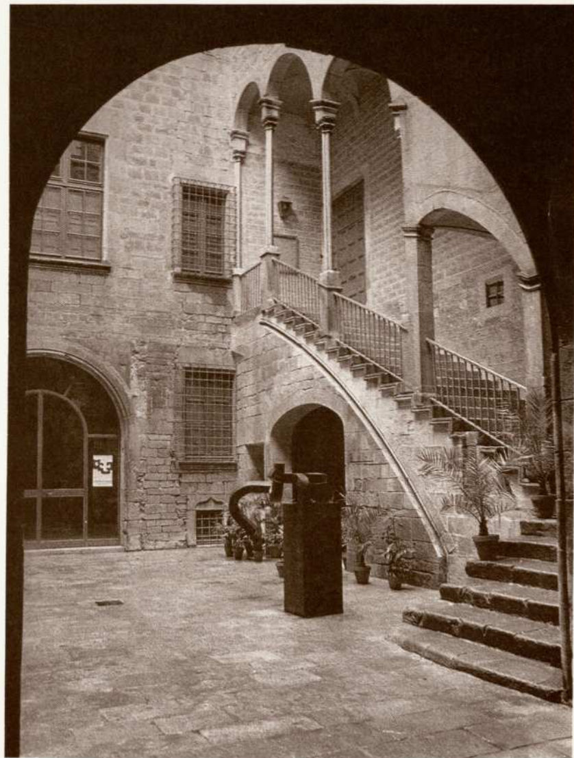
Galeria Maeight - Palau Cervelló - Montcada, 25 - Barcelona (España)