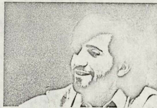
PASCUAL: UNIR NAVARRA A EUZKADI