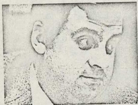
DEL BURGO: EUZKADI CONTRA EL FUERO