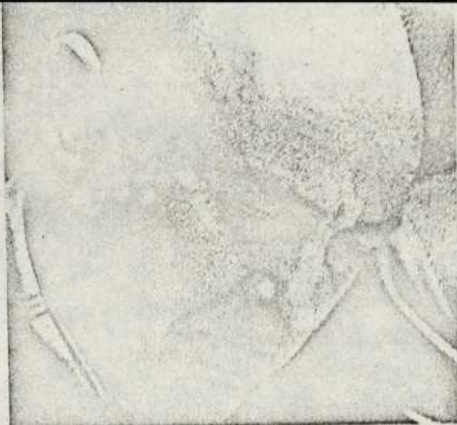
CABALLERO: MITAD Y MITAD