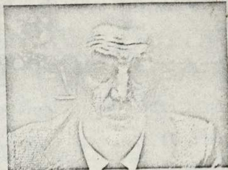
GARAICOECHEA: NAVARRA ES VASCONIA