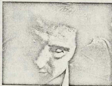
ARBEOLA: ESTADO FEDERAL

"el espíritu autónomo foral ha estado presente en todos los movimientos autónomos navarros desde hace muchos años, pero con el concepto de reintegración foral ocurre que casi nadie ha sabido lo que quería decir". "Creo —añade— que la fórmula sería volver al Estatuto de 1931, que, aunque fue elaborado fundamentalmente por la derecha, llevaba consigo una serie de gérmenes de libertad y autonomía. De todas formas, creo que iremos hacia un estado federal o de grandes autonomías regionales."