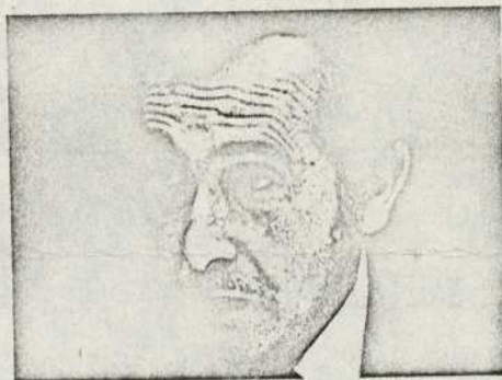
URMENETA: QUE NOS DEVUELVAN LO NUESTRO

y a los poderosos, fruto del sistema que hoy padecemos. Si en España este sistema ha sido malo, aquí, en Navarra, todavía ha sido peor. El Fuero no es ningún privilegio, sino un derecho que tenemos y que deseáramos que concediesen a otros pueblos de España. Navarra pactó con Castilla para formar España. Si Navarra cumple, es la otra parte la que tiene que cumplir, dándonos la autonomía que nos corresponde. Esta autonomía tenemos que buscarla dentro de Navarra, para que no sea la Diputación esa gran centralizadora de nuestro país. Hay que actualizar el Estatuto de 1839, sobre el espíritu con que fue hecho."