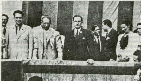
1937: Intensa colaboración vasco-catalana, Irujo, Companys, Aguirre. 1974: La lucha continua.

Joan gaitzen guziok alkarrekin asmo ta bide zabaletan barrena!