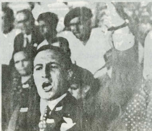
JOSE ANTONIO DE AGUIRRE EN EL ABERRI EGUNA DE IRUÑA

Respetadas las modalidades forales de cada región, la unidad vasca, que el Estado vasco garantizaba, adoptó siguiendo la tradición, una forma federativa.