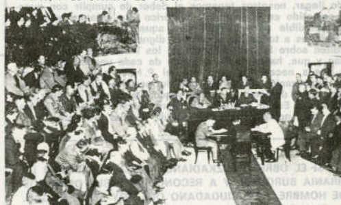
Momento histórico en que la Asamblea de Municipios Vascos, reunida en el salón de la Casa de Juntas, eligió como Presidente del Gobierno Vasco al Lendakari José Antonio de Aguirre y Lecube