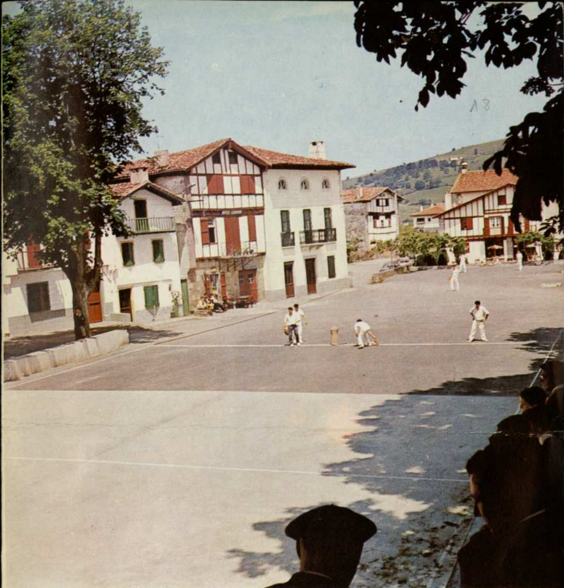
Ainhoa. Partido de rebote. [Una ilustración del próximo tomo]