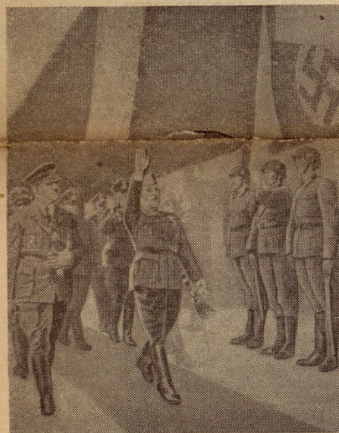
Franco-Hitler (Hendaye, 1942)

En fonction de ce dernier paragraphe, on apprenait qu'au cours de l'année 1947, quatre Etats firent connaître au Secrétaire général qu'ils avaient rappelé les ambassadeurs et les ministres qu'ils avaient en Espagne ; dix-huit Etats déclarèrent qu'ils n'avaient dans ce pays ni ambassadeurs ni ministres ; trente firent connaître qu'ils n'avaient aucune relation diplomatique avec le gouvernement de Franco ; enfin, un