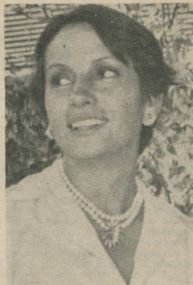
TIEMPO ROSA LUZ ALEGRÍA ...conocer su patria...

Asimismo, indicó que la actividad turística proveniente de Arizona y Texas, sólo se aprovecha en un 2%, pese a que representa un gran potencial que el país todavía no explota adecuadamente. Tanto las autoridades del sector como los prestadores de servicios, han establecido