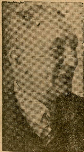
.... LAUREANO GOMEZ .... .... Felicitado....