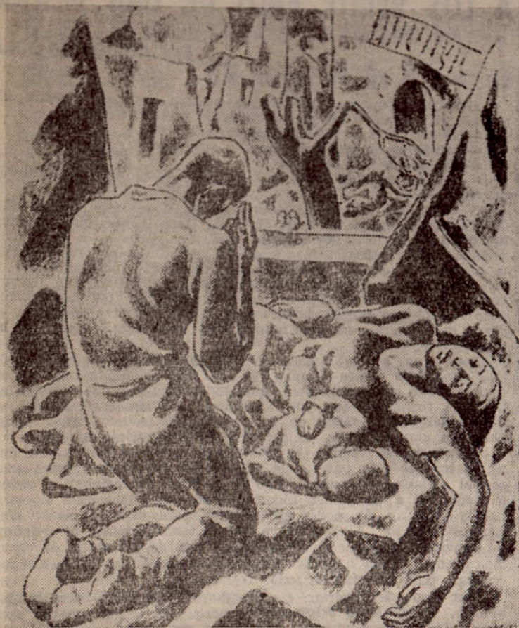
GUERNICA, por Aurelio Arteta

Un mes de abril, hace seis siglos, fué fundada la villa de Guernica; otro mes de abril, hace veinte años, fué destruida.