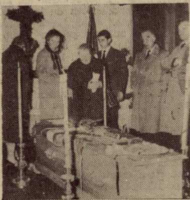
A.N.V. hace guardia al cadáver del Lendakari en Donibane.

"El bardo Iparraguirre, el juglar de la vetusta raza cuyo origen se pierde en la noche de los tiempos, pidió al venerable roble que expandiera sus frutos por el mundo. Y los vascos, los hijos y los nietos de Elcano, proyectaron su nobleza por todos los rumbos oceánicos, dándole a su tierra, forjada en el yunque pirenaico, vitalizada por los golpes de la galerna, del mar embravecido, la alcurnia de la universalidad. Es difícil hallar un rincón en el orbe donde no haya un vasco, bien plantado, con profunda raigambre y feraz fructificación, todos los fieles al mandato inscripto en piedra en el frontis de la casa solariega: "Ni tiranos ni esclavos". A esos vascos habló, después de 1939, cuando el epílogo adverso de la tragedia ibérica lo obligó a dejar su tierra, José Antonio de Aguirre. Y esos vascos lo rodeaban, lo aclamaban, lo seguían, como pudimos comprobarlo aquí, en la Argentina, en 1941 y en 1945, en sus conferencias y en actos de encendida fe en el idealismo de la estirpe, resumido en el lema que auna al misticismo con el ancestral amor a la