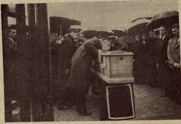
Leizaola besa el féretro después de jurar el cargo de Pte. de Euzkadi.