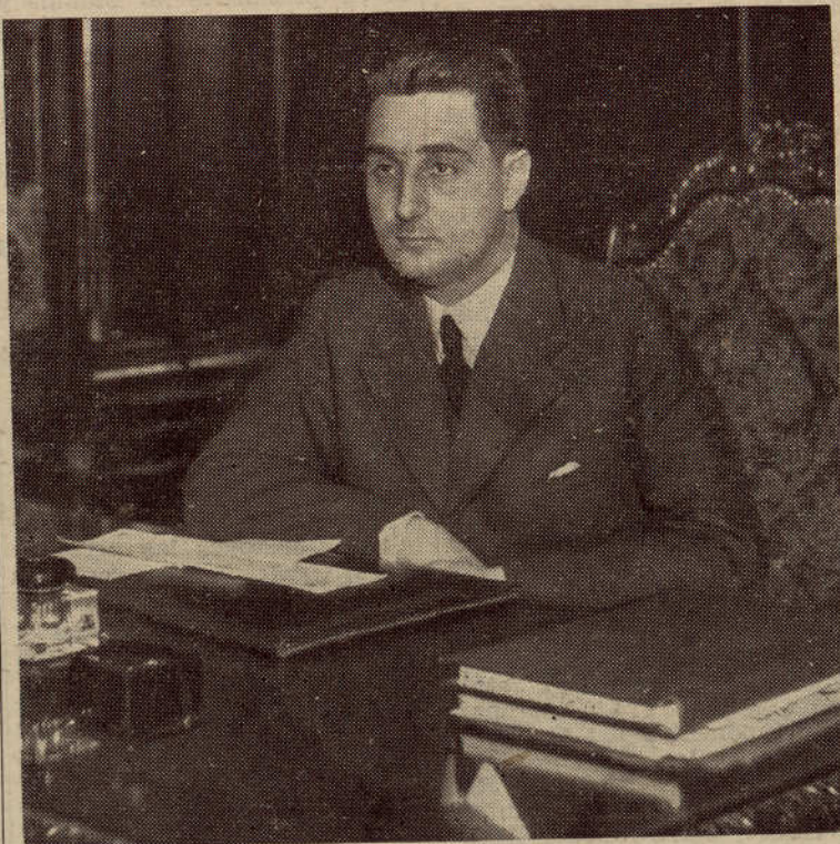
El nuevo presidente vasco