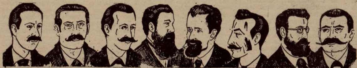
LOS MARTIRES DE CHICAGO: Spies, Ling, Parsons, Fielden, Neebe, Fischer, Schwab y Engel, en cuya memoria se instituyó en todo el mundo el PRIMERO DE MAYO.

AÑO XV - BUENOS AIRES, CARACAS MEXICO, MAYO DE 1971 - Nº 179