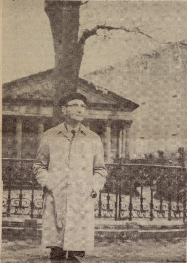
Testimonio de Aberri - Eguna 1974: El Lendakari en Gernika

Revolución democrática en Portugal. ¿Angola, Mozambique y Guinea independientes...? Secuestraron en París a Suárez, director del Banco de Bilbao. Bombas en Donostia.