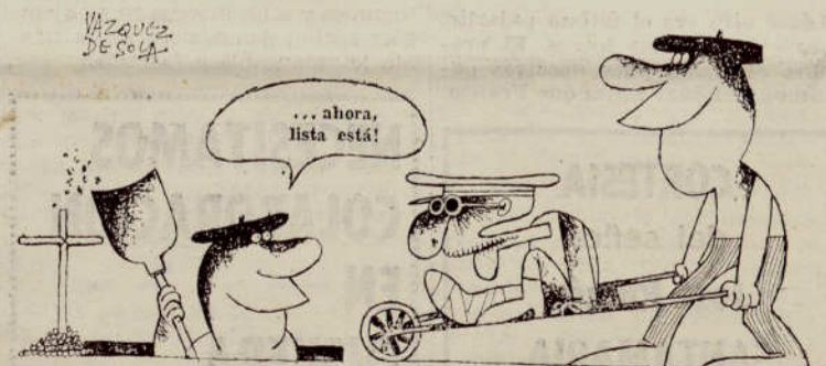
La apertura que todos esperamos (Frente Libertario)