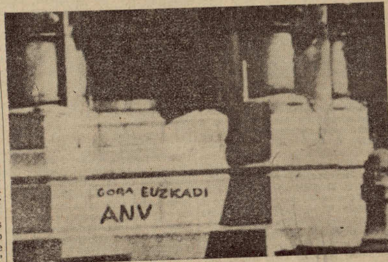
El monumento a los Fueros de Navarra "condecorado" por la resistencia, es nuestro "christmas" para este año que termina y para el que va a empezar.