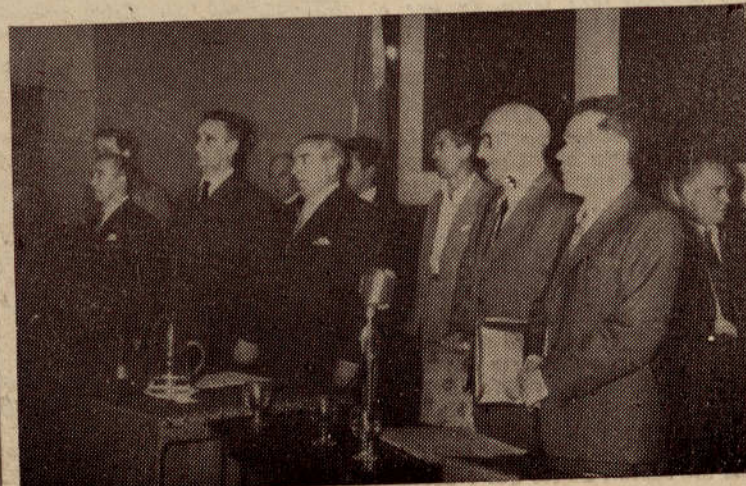
"Gora ta gora Euzkadi... Así terminó la Asamblea de la C.A.E.V.

Tras unas palabras en euskera en recuerdo de Aguirre, manifestó que era imposible que dijera todo lo que tenía que decir. Se dirigió en primer lugar al delegado republicano Sánchez Albornos para decirle que estaba frente a una página de historia, que es una protesta y un anuncio. En las guerras carlistas —prosiguió— los vascos se pronunciaron por el bando tradicionalista, pero siempre pidieron que en su nombre hubiera una representación responsable. En 1936 los vascos pidieron el Gobierno de