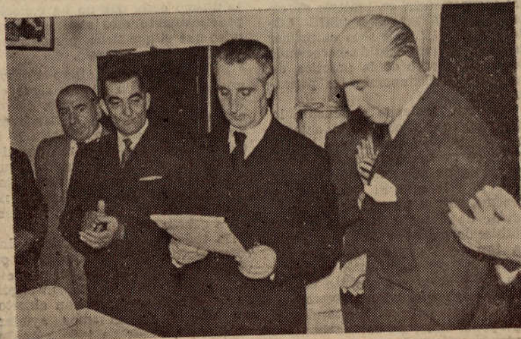
Leizaola socio honorario de Eusko Txokoa

Todos los diarios, radios y T.V., uruguayos y argentinos han informado ampliamente sobre las actividades del Presidente Leizaola, y en varias emisoras el Lendakari ha dirigido mensajes a los pueblos del Uruguay y la Argentina y a todos los pueblos libres de América.