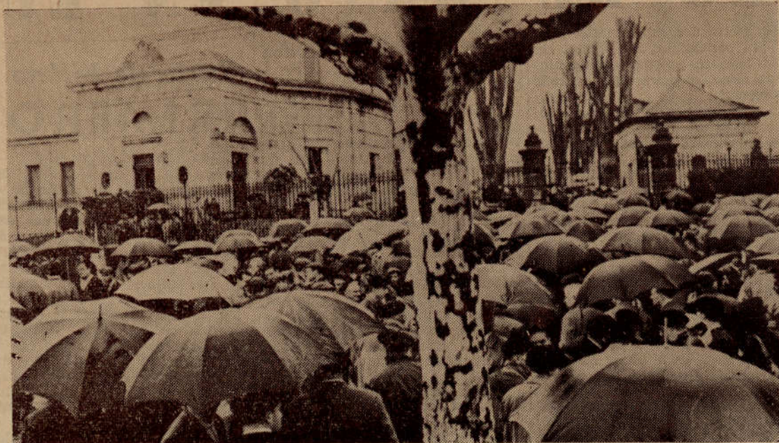
Aberri-Eguna 1964 Gernika'n.