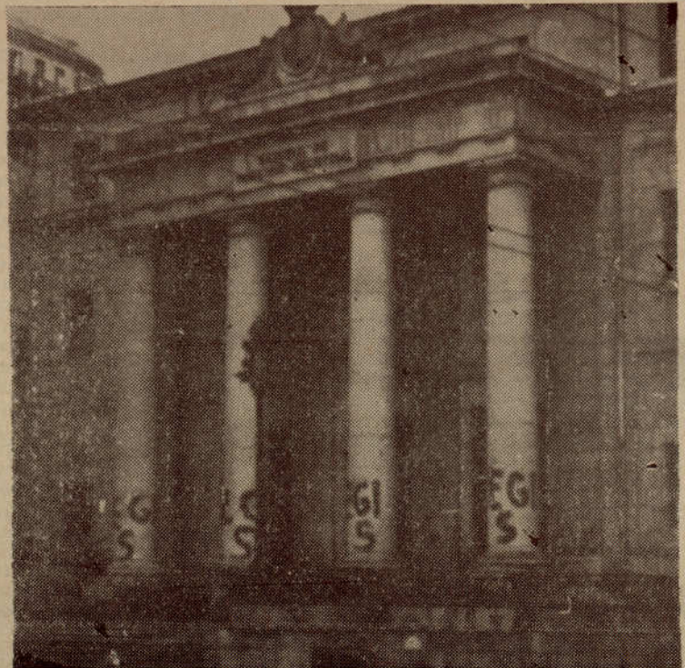
Así recibieron en Bilbao los de Eusko Gaztedi (EGI) el 18 de julio pasado; he aquí la Escuela de Maestría Industrial de Atxuri y bajo las siglas de EGI la S de Sabino; todo ocurrió en el amanecer del aniversario del día nefasto; en Artxanda igual, en Pagasarri lo mismo, en todas partes, en todas las paredes, la S de Sabino.

Redacción y Administración FLORIDA 461 — Bs. Aires