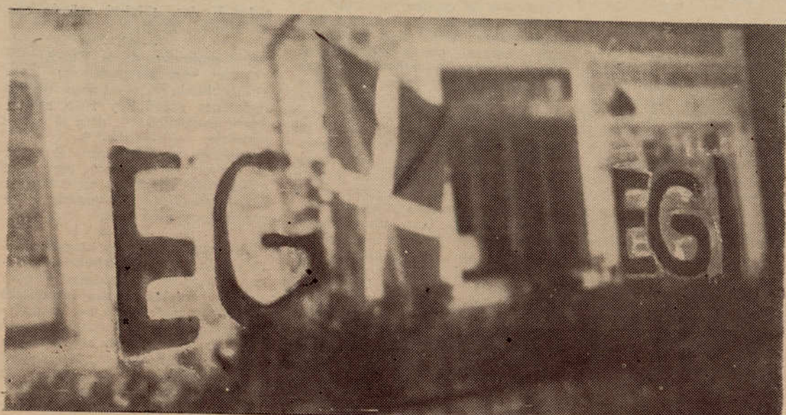
Este es el testimonio de la acción de la resistencia en la escuela de Areatza y de la represión que motivo el sermón de arriba.

Los salarios no son nada. Que lo sepan bien los turistas. Aquí una familia no puede vivir cuyo jefe sea el que trabaje solamente. Vegetan, pero nada más. Las maniobras del franquismo sobre una ofensiva internacional de su política económica no servirá para nada. En Bruselas ya lo saben. —Y, aurrera por un año 1965 digno de nuestra liberación. Desde el "bocho" Agur.