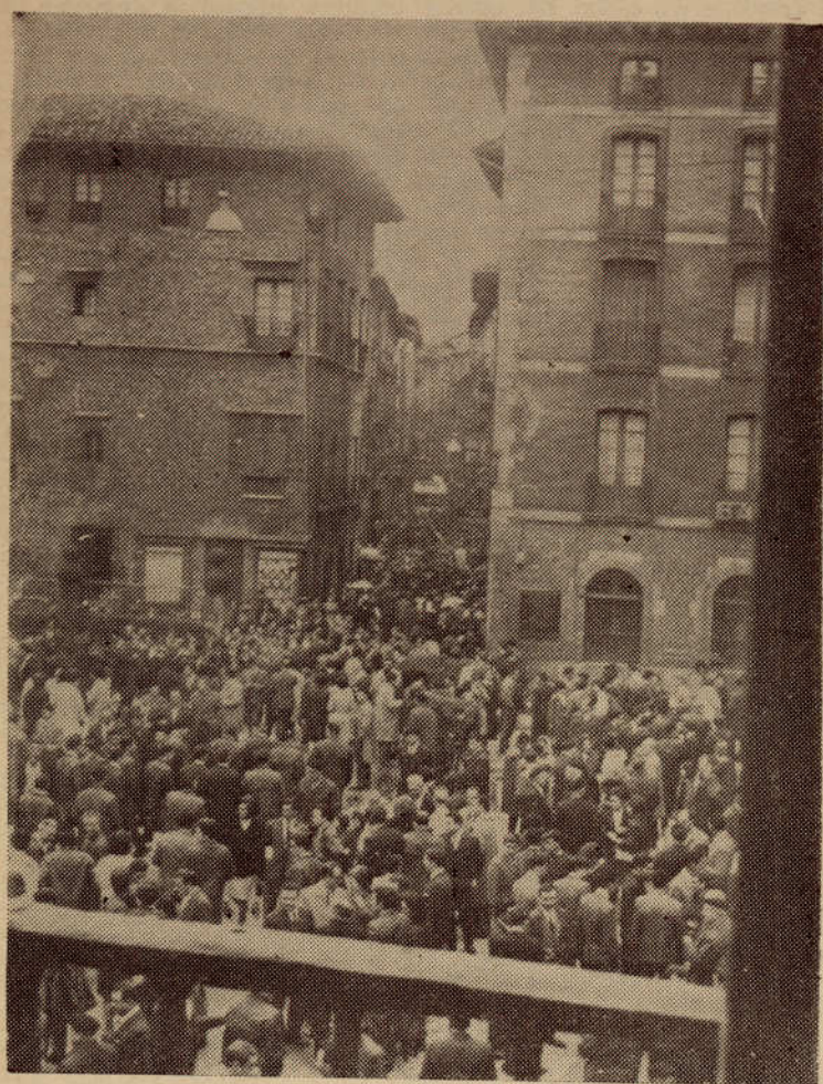
Aberri-Eguna. — Aspecto parcial de la plaza de Bergara el día 18 de abril.

San Sebastián. (OPE) — Las autoridades franquistas habían anunciado por la prensa local que la concentración de Vergara la consideraban ilegal y subversiva. Días antes se supo que el Gobierno de Madrid había decidido movilizar cientos de policías armados para impedir que los manifestantes vascos pudieran concentrarse en la villa. Periódicos como el "Daily Express", de Londres, anunciaron que estas fuerzas de policía iban a envolver la villa de Vergara, formando un cinturón en su derredor, para contener la manifestación masiva antifranquista proyectada por los nacionalistas vascos, cuyas organizaciones están declaradas fuera de la ley. Pues bien, todo esto no ha impedido que de quince a veinte mil vascos se concentraran el domingo pasado