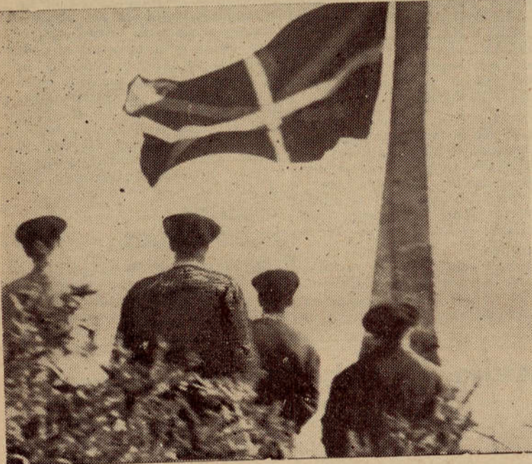
BELKOAIN. — Un grupo de jóvenes gudaris ante una bandera vasca que acaban de colocar en la cruz de cemento, canta el himno vasco. Después, al observar en la falda del monte la presencia de la guardia civil, los gudaris se retiraron ordenadamente.