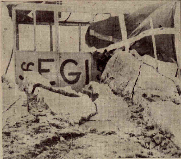
MONTE ADARRA. Gran ikurriña colocada por miembros de Eusko Gastei en homenaje a Sabino. Observese sobre el desvencijado mirador de la cima, las siglas EGI y los lauburus.

Redacción y Administración FLORIDA 461 — Buenos Aires