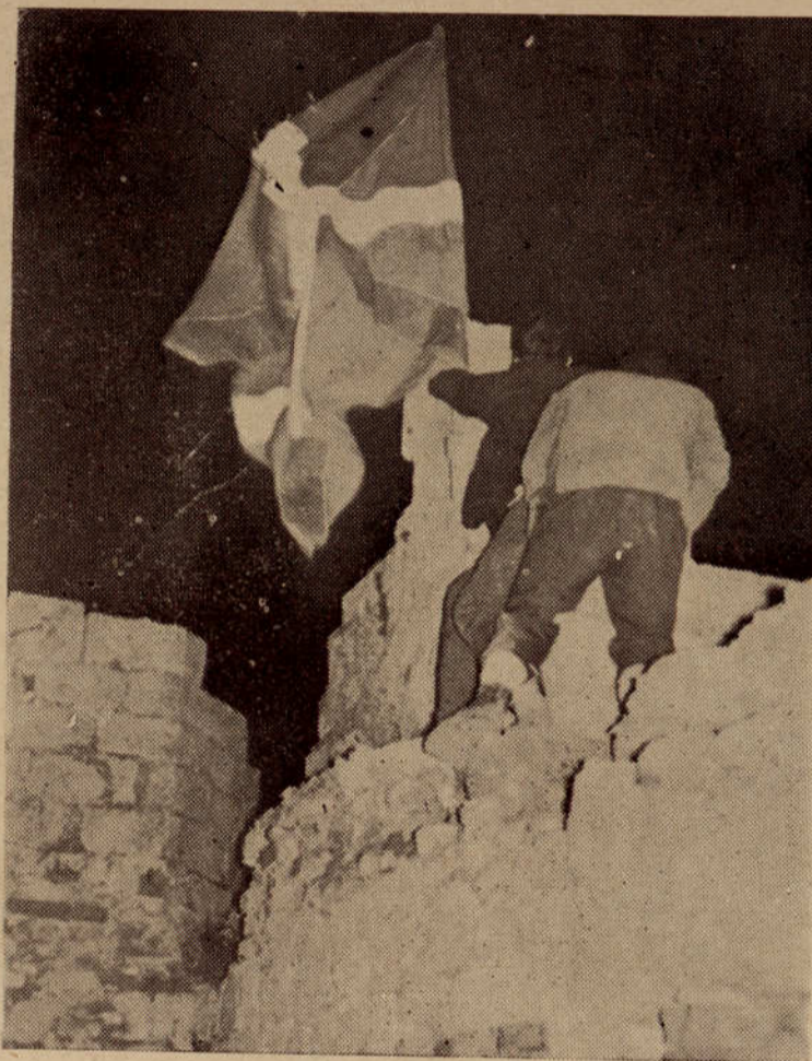
MONTE SEVANTES. Dos jóvenes de EGI colocan en las ruinas del castillo la bandera de Euzkadi.

Muchos miles de yanquis se afanan en la recuperación de todo lo perdido en la tierra y en el mar, con trajes y máscaras protectoras contra la radiactividad. Otros submarinos, otros barcos, pueden estar haciendo lo mismo para descubrir los secretos del B-52, de la "nodriza" y sus restos. El miedo atómico aumenta, pues los B-52 andan como Pedro por su casa entre Zaragoza, Torrejón, Morón y La Rota, y vienen y van muy lejos. Por todos los cielos peninsulares y por otros cielos. Con bombas atómicas. Pero eso no es lo más malo. Lo peor es que otros submarinos, otros aviones, otros barcos, otras plataformas con cohetes nucleares, con bombas atómicas, están apuntando permanentemente a Zaragoza, a Madrid, a Sevilla, a Cádiz, etcétera, etcétera, para borrarlos del mapa en un momento determinado. Hiroshima y Nagasaki están presentes en toda la Península por obra y gracia del "caudillo" y de los yanquis. El "caudillo" ha tenido la caradura de decir recientemente que los yanquis están en la Península como amigos y son queridos por el pueblo, andan como en su casa. Como que son los amos y él es "caudillo" por obra y gracia de Hitler, de Mussolini y de la U.S.A. El "GO HOME", fuera los yanquis, asesinos, fuera el "caudillo", etcétera, es unánime en todas partes. La bomba desaparecida y todo lo demás puede ser el principio del fin. — TXE