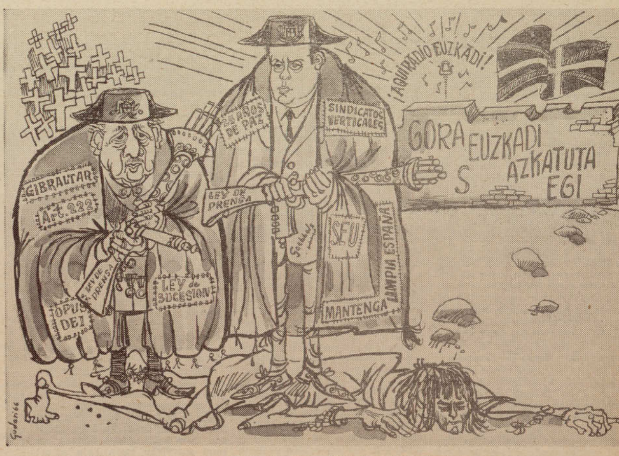
GENERAL FRANCO: — Estos vascos siguen sin entender los beneficios de la paz española. SARGENTO FRAGA: — Pues yo empecé todos los medios para que comprendan, mi general.

DESPUES DE LEER Tierra Vasca ENVIALO A UN AMIGO